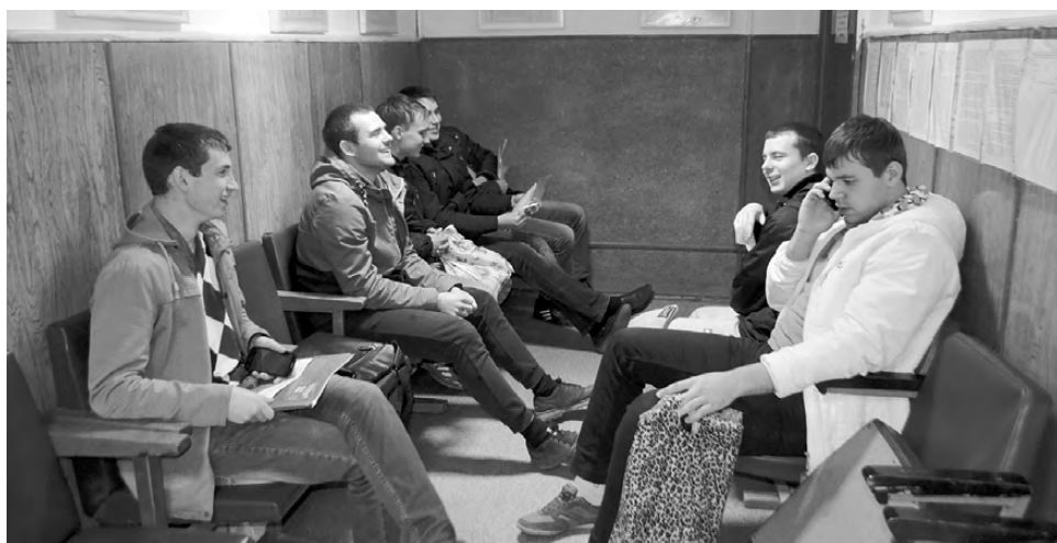
Среди призывников царит боевое настроение.

По словам А. Заврина, в этом году впервые планируется отправка двух военнослужащих из Режа на Северный флот ВМФ России в расположение войск, дислоцированных в Арктической зоне для выполнения задач по защите национальных интересов страны в Арктике. В воздушно-десантные войска отправится всего 1 режевлянин, трое будут служить в морфлоте. Остальные идут служить пехотинцами, в их функции будет входить охрана и оборона территории части и её объектов.