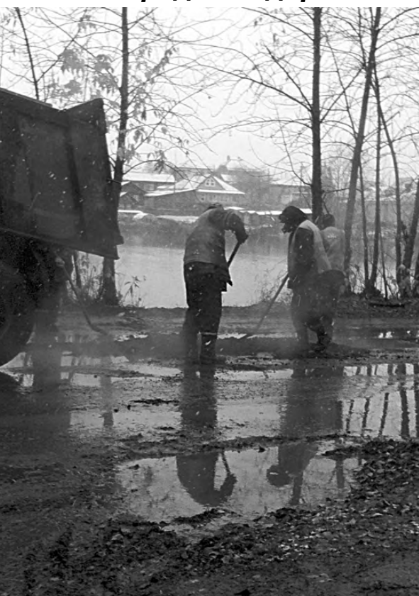
Рабочие кладут асфальт на улице Павлика Морозова.

возмущённых жителей. 7 октября, когда на улице шёл мокрый снег с дождём, люди увидели, как на Павлика Морозова рабочие клали асфальт прямо в лужи.