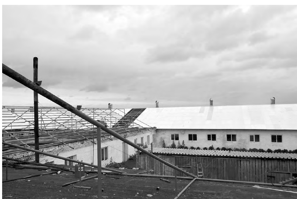
Реконструкция идёт постоянно – сейчас продолжается обновление кровли корпусов.