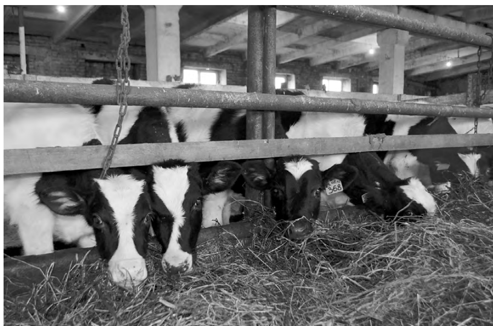
Поголовье каждый год увеличивается.