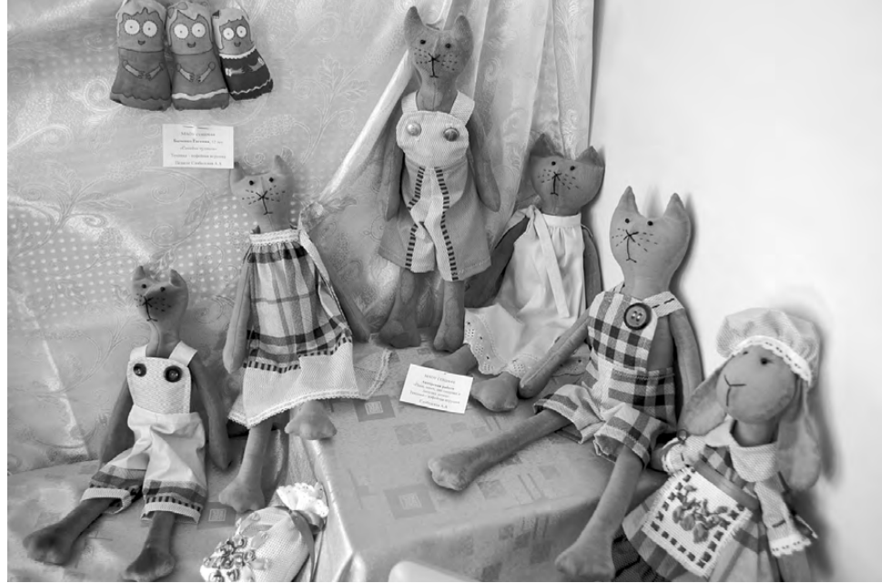
Игрушки в чердачном стиле.