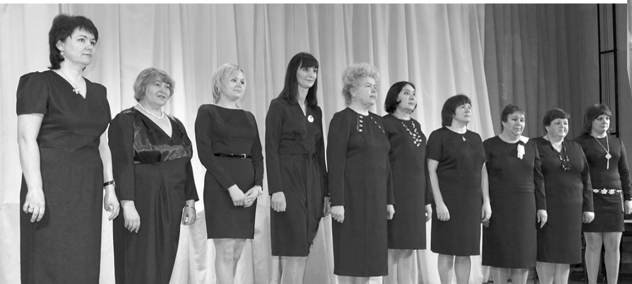
Хор учителей школы №1.

7 марта педагоги и ученики школы №1 посетили военный госпиталь в Екатеринбурге. Для пациентов лечебного учреждения - ветеранов Великой Отечественной войны и участников боевых действий - дети и учителя подготовили праздничную программу, назвав её «С любовью к Вам!».