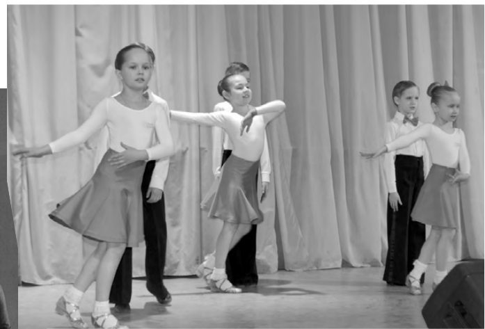
Вальс в исполнении воспитанников танцевального спортивного клуба «S.way».