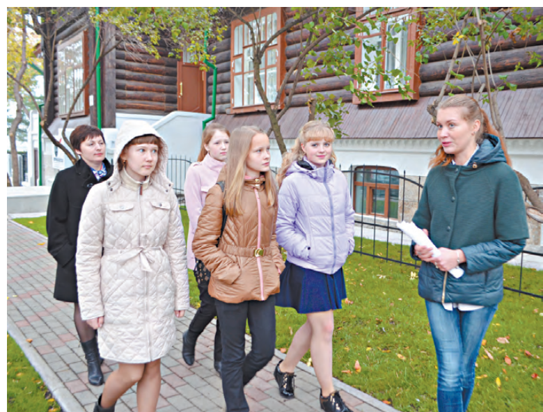
После награждения Яна провела для юных корреспондентов экскурсию по Литературному кварталу Екатеринбурга.

В юном возрасте закладываются важные основы будущих достижений. Воспитание талантливой, целеустремлённой молодёжи, повышение уровня образования населения - ключ к обеспечению долгосрочного благополучия и процветания Среднего Урала. Эту мысль губернатор Свердловской области Евгений Куйвашев озвучил, отмечая заслуги лучших школьников региона.