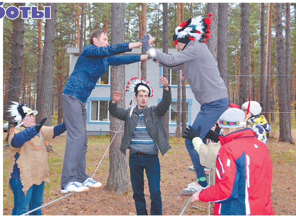
Главное – не личный результат, а взаимопомощь и сплочённая команда.