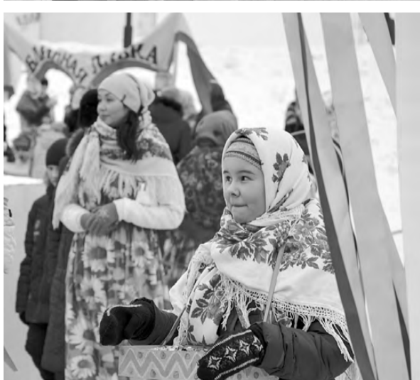
Бойко торговали коробейники.