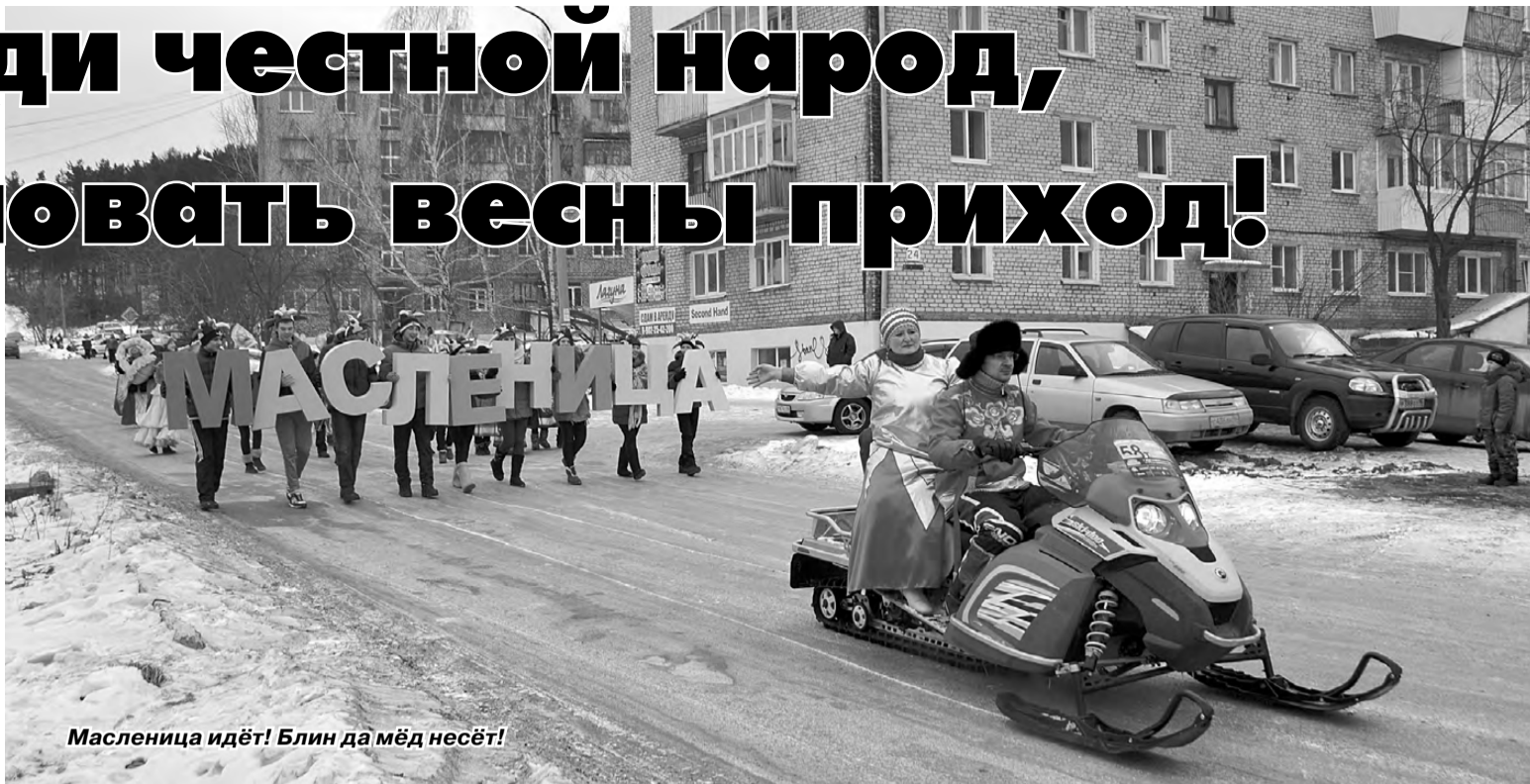
Масленица идёт! Блин да мёд несёт!

P.S. Больше фото вы можете посмотреть в фотоальбоме на нашем сайте rezh-vest.ru .