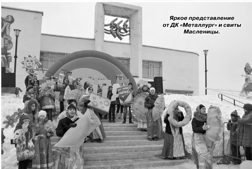
Яркое представление от ДК «Металлург» и свиты Масленицы.