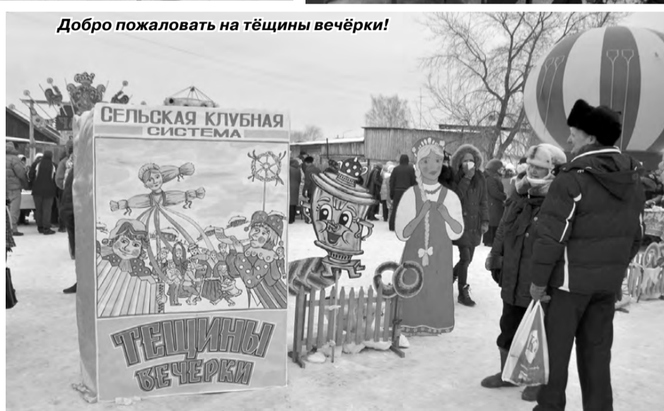
Добро пожаловать на тещины вечерки!