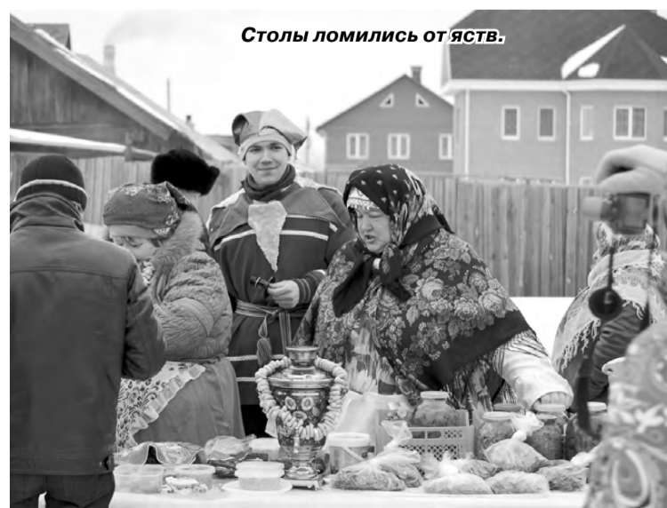
Столы ломились от яств.