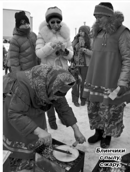
Блинчики спылу, сжару.