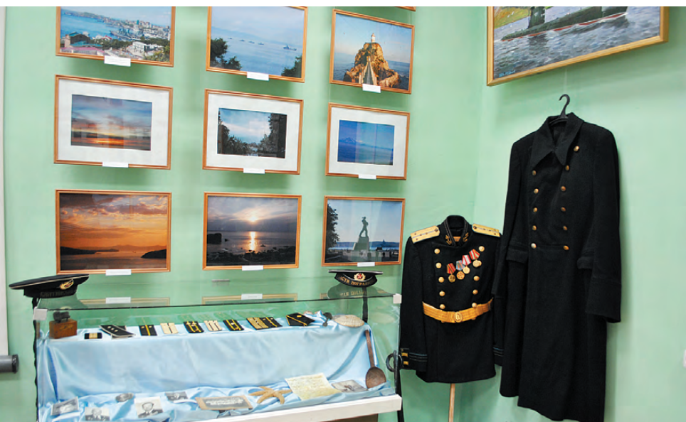
Фотовыставка «У океана Тихого есть берег Уральский».