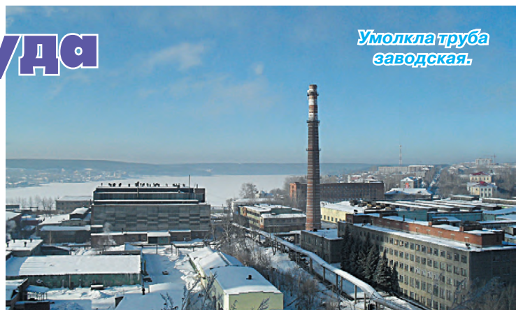
Умолкла труба заводская.