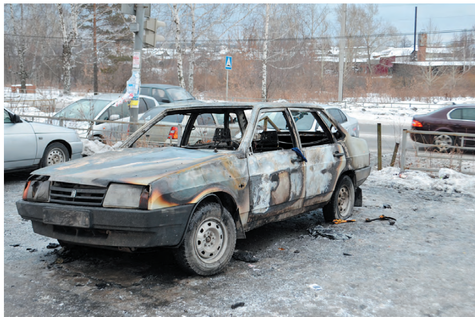
Сгоревший «ВАЗ-21099». Пожар сильно повредил соседний с ним автомобиль - седан «Ровер». Попытки спасти машину успехом не увенчались.