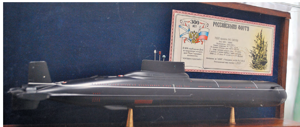
Макеты подводных лодок – наглядные примеры для гостей выставки.