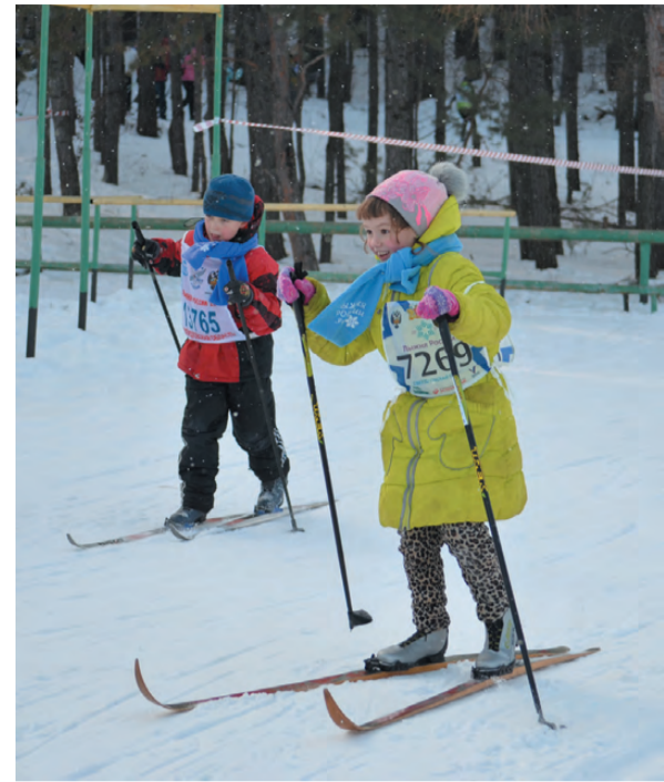
На финишной прямой.