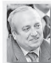
Франц Клинецевич, депутат Госдумы России:

«Сегодня мир перевернулся с ног на голову. Важно, чтобы настоящие истины, построенные на аргументации, исторических фактах, здравом смысле и жизненном опыте, были донесены до нашей молодежи. Упустив этот момент, мы потеряем страну. Знаю, что центр патриотизма находится здесь, на Урале. Отсюда, из этого оплота нашей державы мы будем черпать истоки безграничного патриотизма, который распространится на всю Россию».