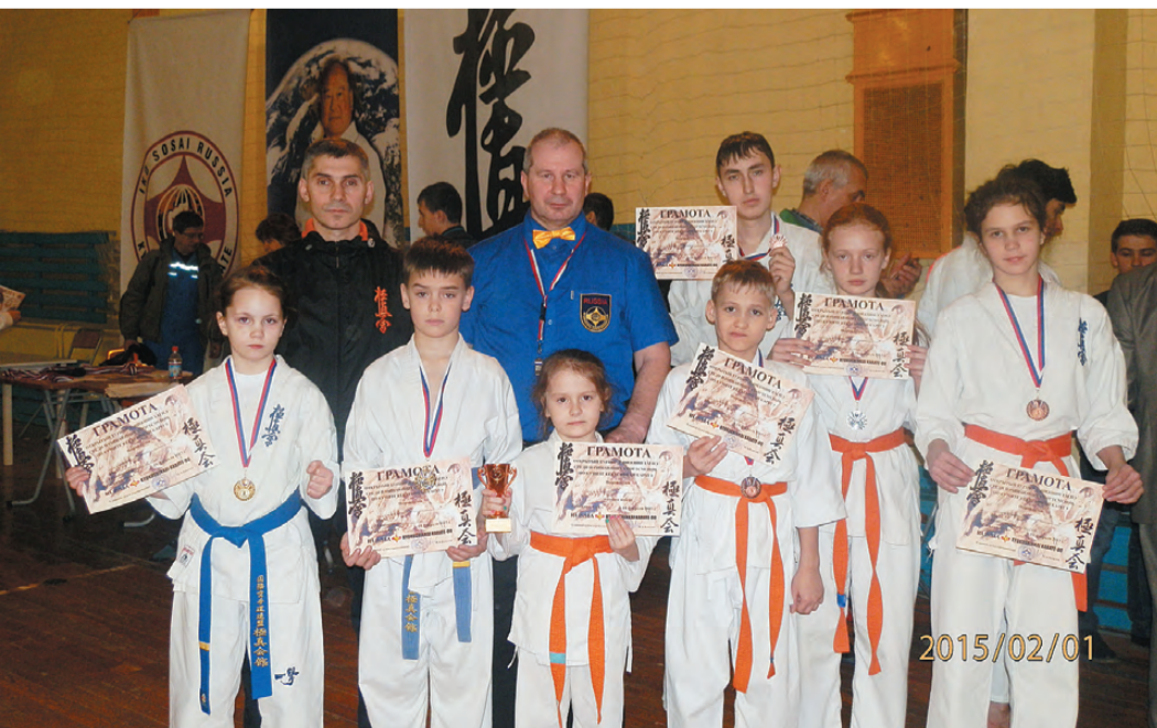
Тренеры и призёры соревнований.

1 февраля в Нижнем Тагиле прошёл открытый турнир среди начинающих спортсменов от 0 до 7 ю. Наш город на нём представили больше 20 спортсменов Федерации Киокушинкай г. Реж.