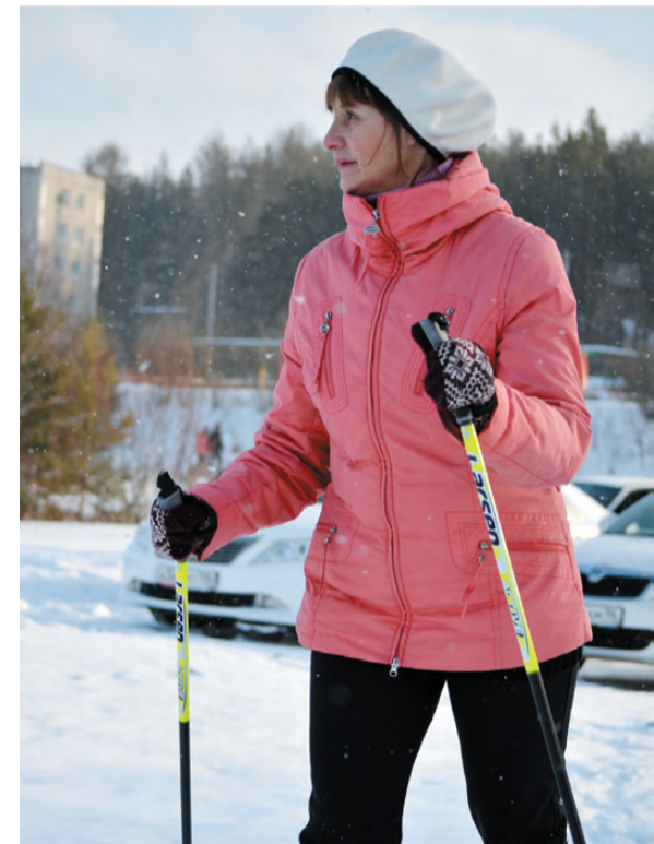
Все спешат на лыжню!