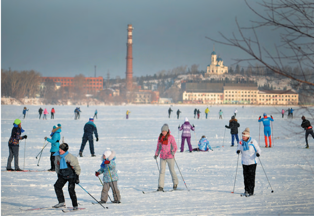
На фоне режевских достопримечательностей.