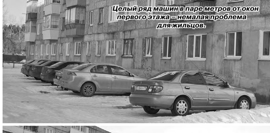
Целый ряд машин в паре метров от окон первого этажа – немалая проблема для жильцов.