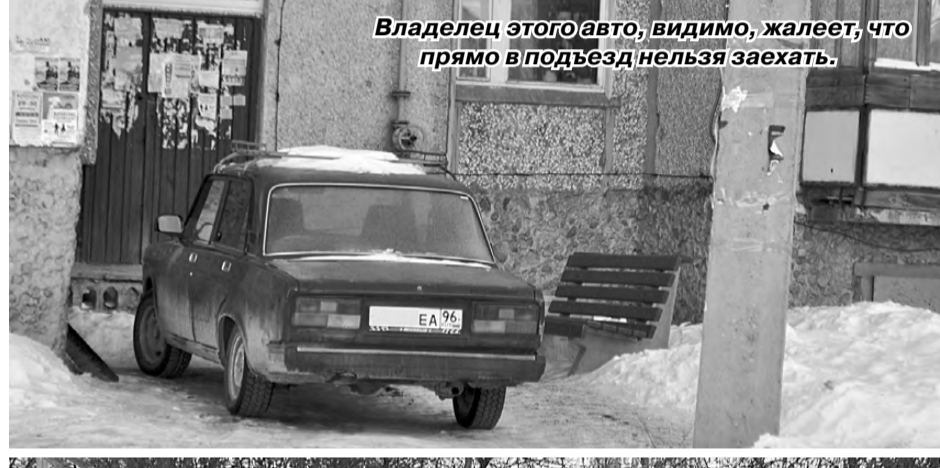
Владелец этого авто, видимо, жалеет, что прямо в подъезд нельзя заехать.