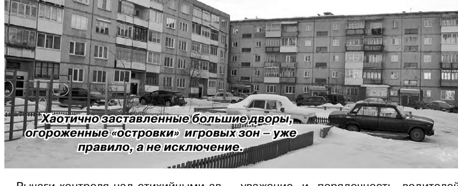
Хаотично заставленные большие дворы, огороженные «островки» игровых зон – уже правило, а не исключение.

Рычаги контроля над стихийными автостоянками всё-таки есть. Но многие ли захотят ими воспользоваться? Сегодня практически в каждой семье есть автомобиль, а вот гараж для его хранения многие не видят и смысла приобретать. Остаётся надеяться только на взаимо-