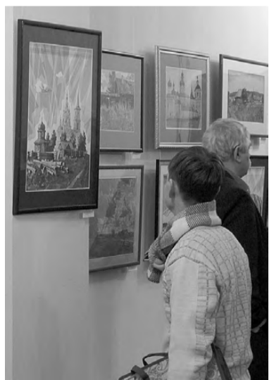
Новые работы В. Лузина вызывают большой интерес зрителей.