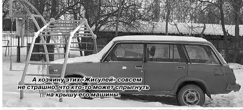
А хозяину этих «Жигулей» совсем не страшно, что кто-то может спрыгнуть на крышу его машины.