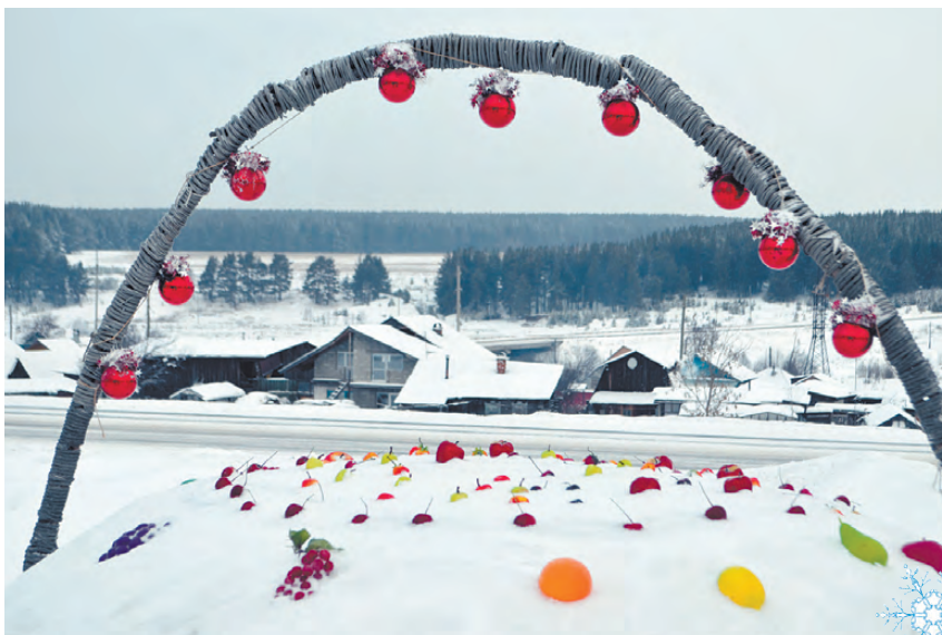
Вид на Кочнево явно преобразился.