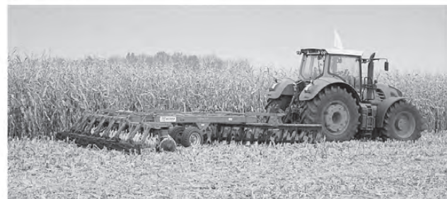
В 2015 году было отмежевано 12,6 тыс. га, в прошлом году – почти 30 тысяч, на будущий год стоит задача ввести в оборот 25 тыс. га.