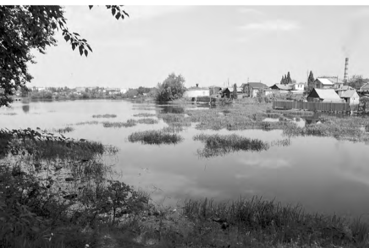
Было. До выкоса травы пруд напоминал кочкарник. Чтобы привести берег и акваторию в порядок, была разработана и утверждена программа рыбохозяйственной мелиорации.

Оксана АНИСИМОВА, фото автора и Арины АГАПОВОЙ.