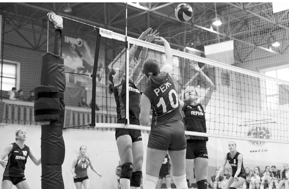
Поединок «Россиянка» - Пермь.

ДЮСШ «Россия» в 21-й раз распахнула двери перед участниками и зрителями традиционного волейбольного турнира среди женских команд «Машиностроитель».