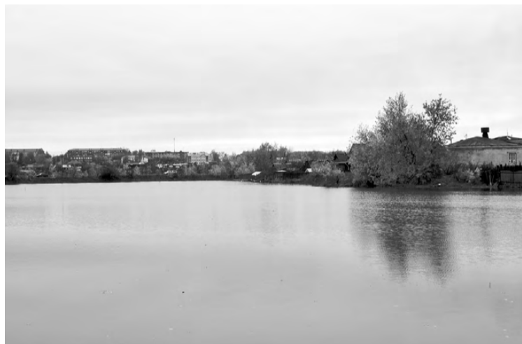
Стало. Очищено свыше 50 тысяч квадратных метров.

Тревога вполне обоснована. Потребительское отношение к водоёму проявляется не только в выбрасывании мусора. Не лучшим образом ведут себя некоторые рыбаки, ставящие сети. Множество утопленных неводов было обнаружено на дне в процессе очистки. Однако попытки рыбаков выловить таким способом донную