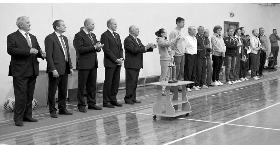
Торжественное открытие соревнований.