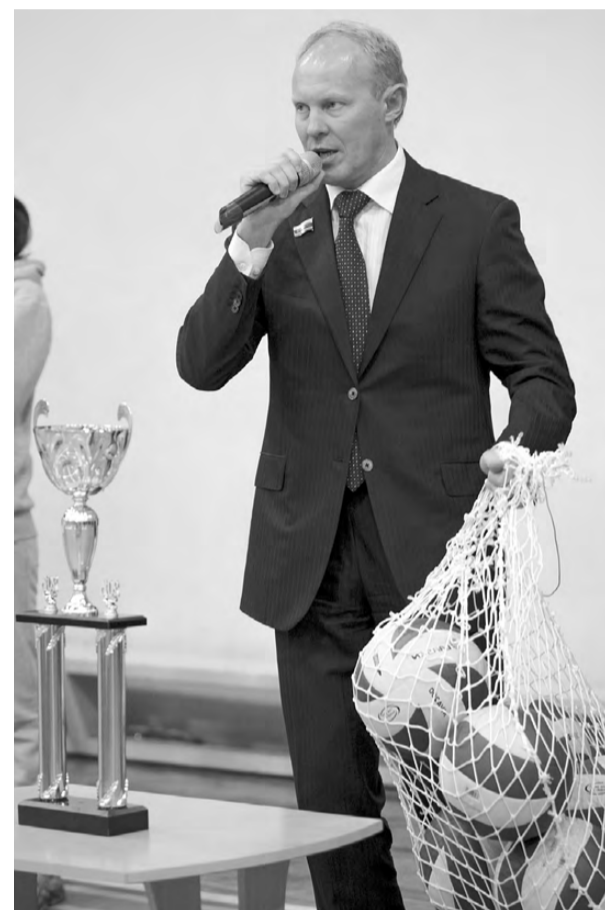
Подарок от олимпийского чемпиона Сергея Чепикова.

листных и непредсказуемых игр, не оставивших зрителей равнодушными.