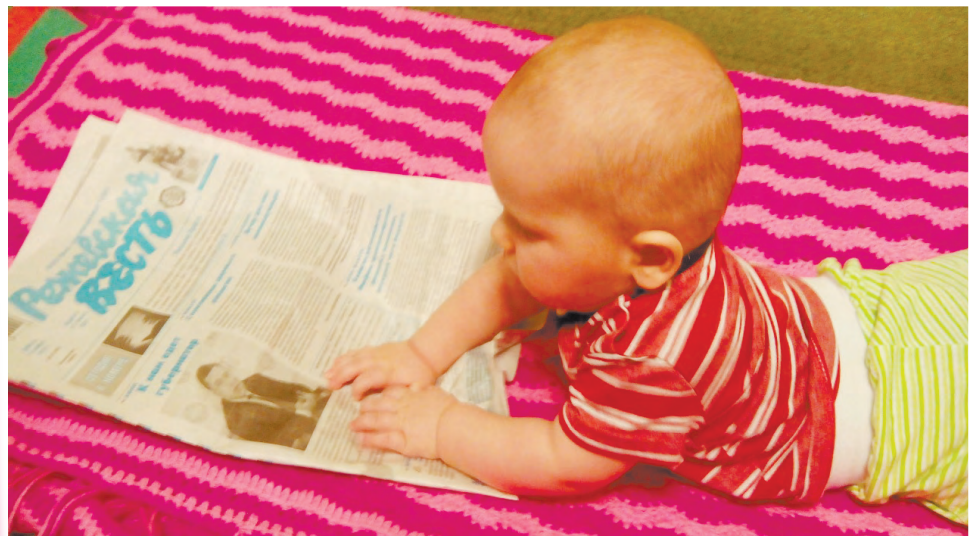
«Вот ты какой, губернатор!».

Победителем фотоконкурса по решению жюри стал Алексей Никифоров с фото «Вот ты какой, губернатор!». Он получил в подарок чайный сервиз. Также всех участников наградили полугодовой подпиской на нашу газету.