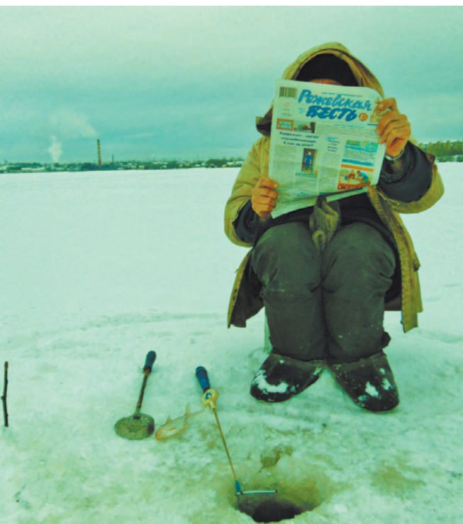
«И не беда, что не клюёт, зато газету почитаю».

Подготовила Арина АГАПОВА.