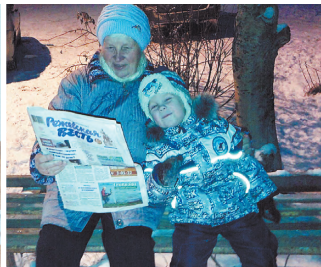
«Вечерние посиделки».