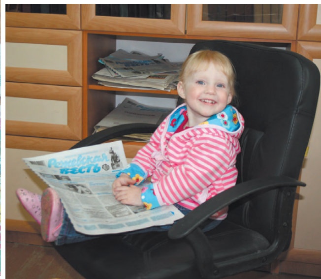
«Смена подрастает».