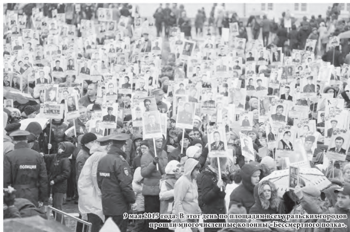
9 мая 2015 года. В этот день по площадям всех уральских городов прошли многочисленные колонны «Бессмертного полка».

Урал дал фронту танки и снаряды, самоходные орудия и авиамоторы, дал лекарства и продовольствие. В годы войны на Урале было сформировано свыше 500 воинских частей и соединений.