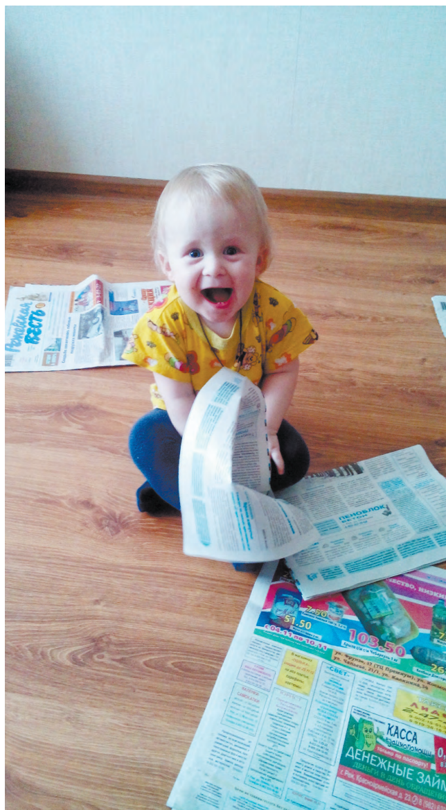
«С малых лет читаю любимую газету».