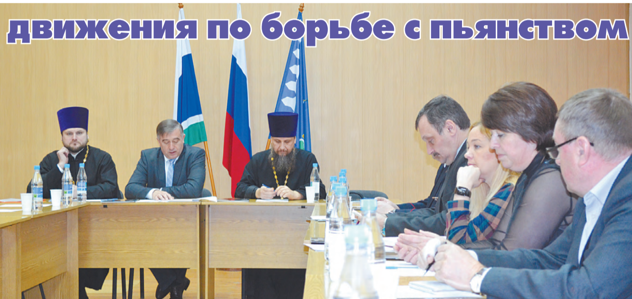
Участники круглого стола отметили новый подход к решению проблемы алкоголизма и выразили заинтересованность участвовать в работе отделения.