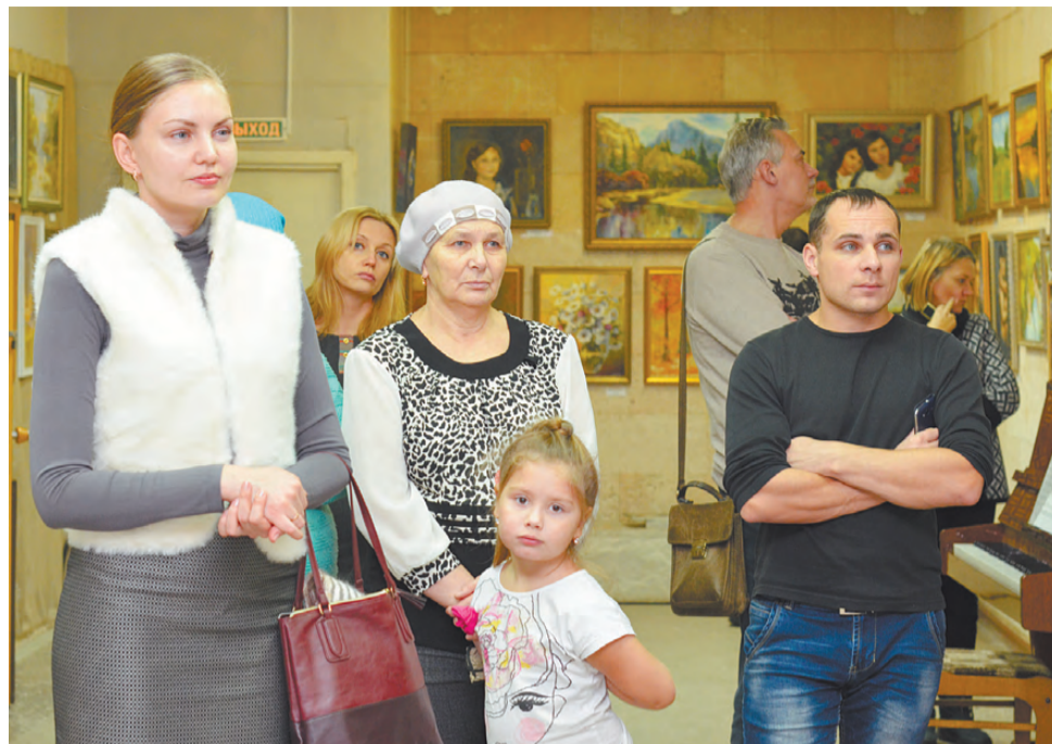
«Вернисаж» открыт для всех!

P. S. Больше фото с открытия выставки смотрите на нашем сайте rezh-vest.ru .