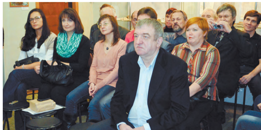
На юбилее собрались единомышленники.

пород и минералов, драгоценных, цветных и поделочных камней; возрождение традиционной культуры камня и многие другие.