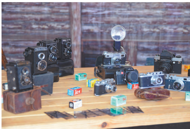
Для журналистов подготовили выставку фототехники XX века.