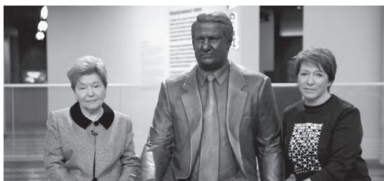
Наина Ельцина и Татьяна Юмашева (дочь): Мы закладываем новую традицию уважительного отношения к президентам, покинувшим свой пост.