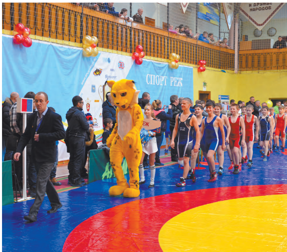
Торжественное появление спортсменов.