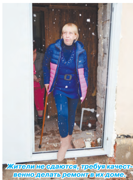
Жители не сдаются, требуя качественно делать ремонт в их доме.

Специалисты подтвердили сомнения жителей в качестве фасадных работ.