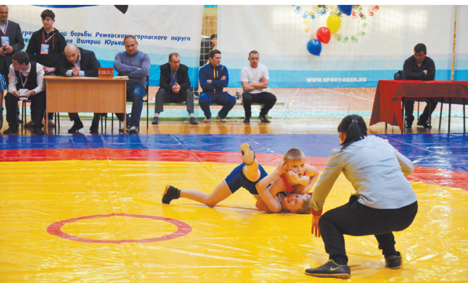
Победить не так просто!