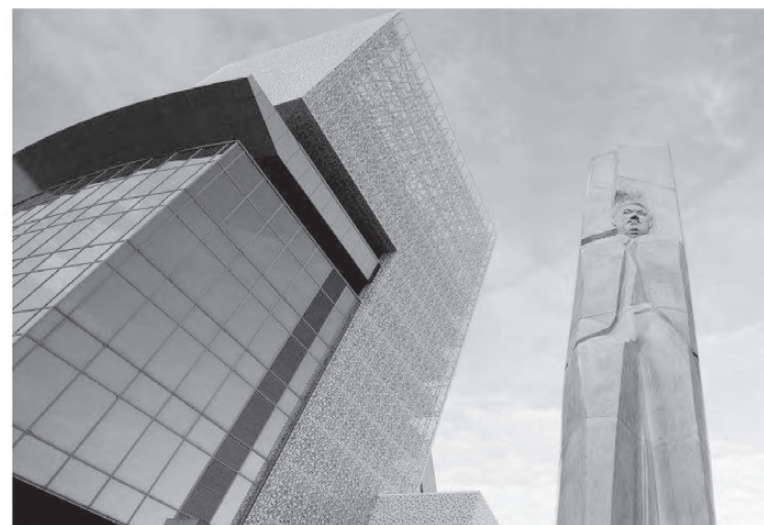
Работы по созданию центра велись с 2011 года. Сейчас это пятиэтажное здание многофункциональной направленности.