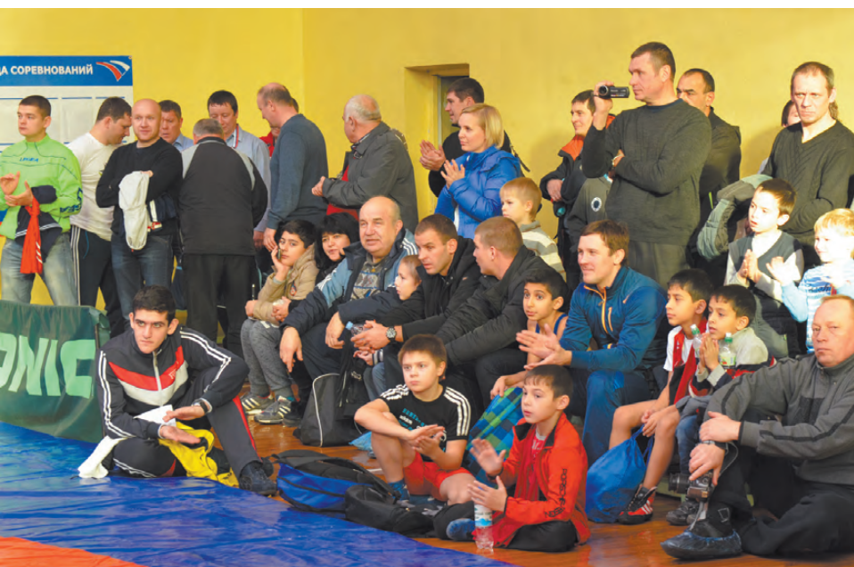
Родители, тренеры и коллеги по команде болеют за своих фаворитов.