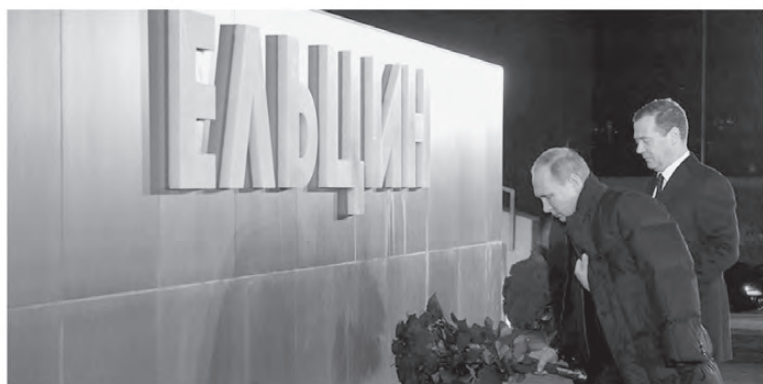
Владимир Путин и Дмитрий Медведев возложили цветы к памятнику первому российскому Президенту.