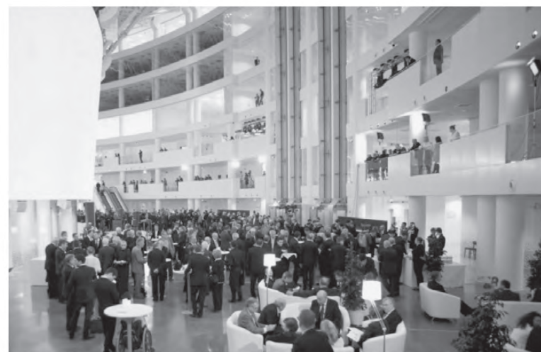
В центре будет библиотека, собрание архивных документов и площадка для открытых мероприятий, конференций, встреч.