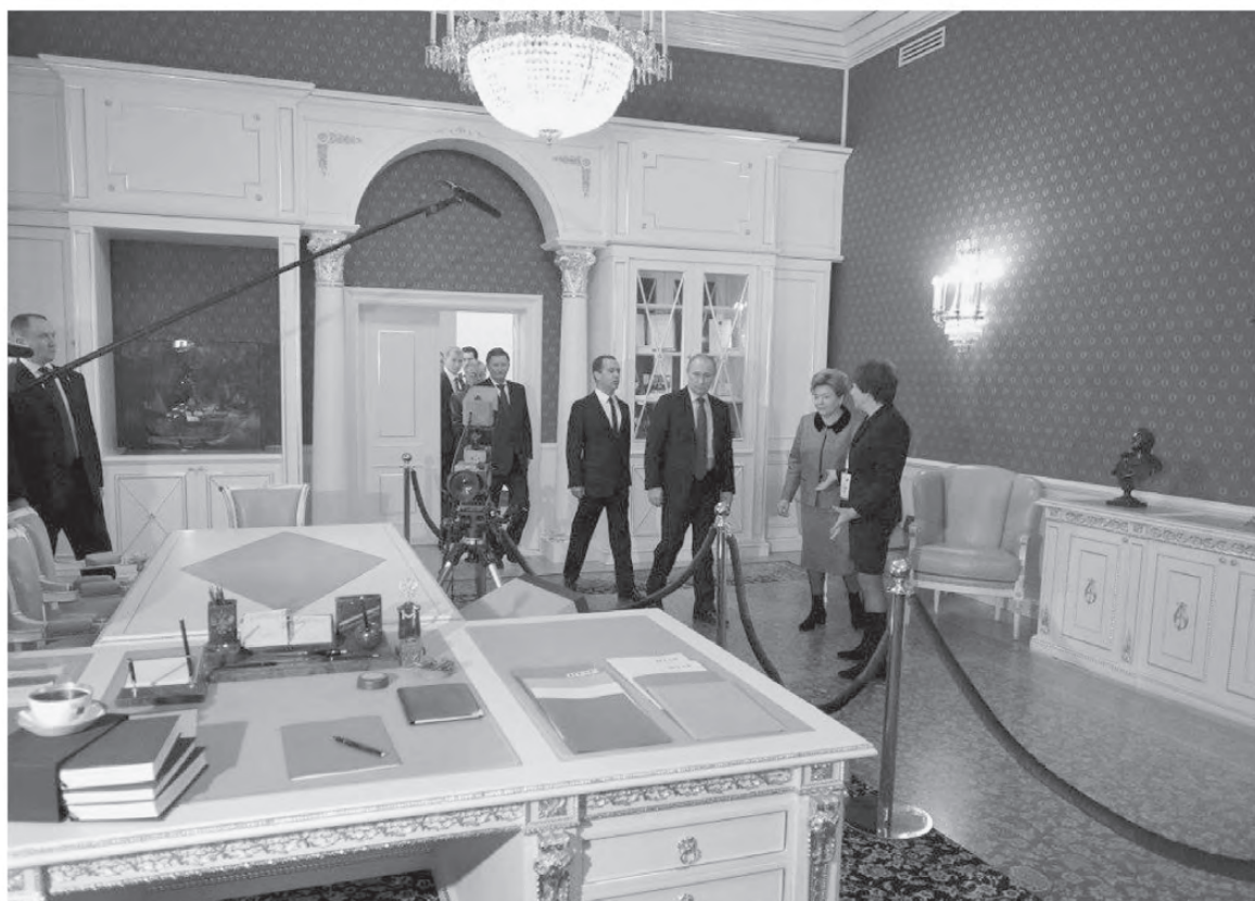
Самый удивительный экспонат – рабочий кабинет первого Президента России, обстановка которого – от письменного стола до штандарта – перенесена из Кремля в музейное пространство.