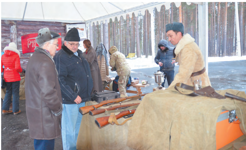
Выставка оружия времён Великой Отечественной войны.