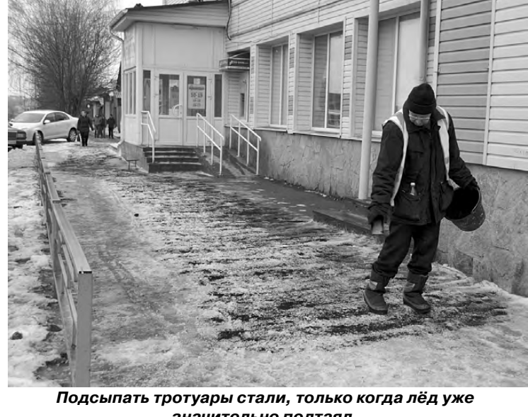
Подсыпать тротуары стали, только когда лёд уже значительно подтаял.