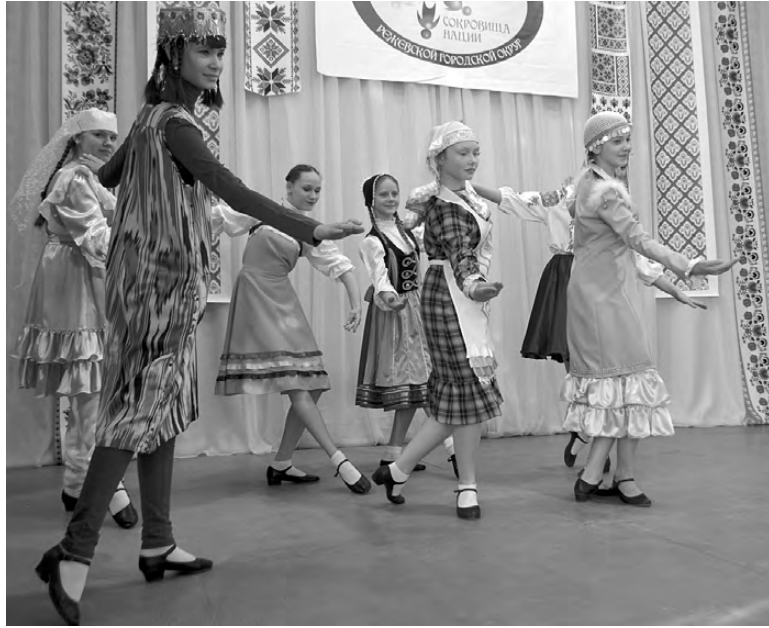
Многонациональный парад невест на сцене Центра национальных культур.