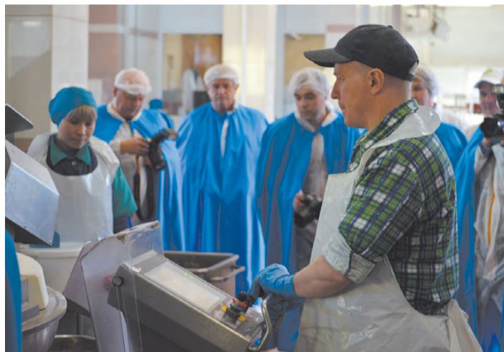
Птицефабрика «нашпигована» современным оборудованием, в том числе для изготовления колбасных изделий.