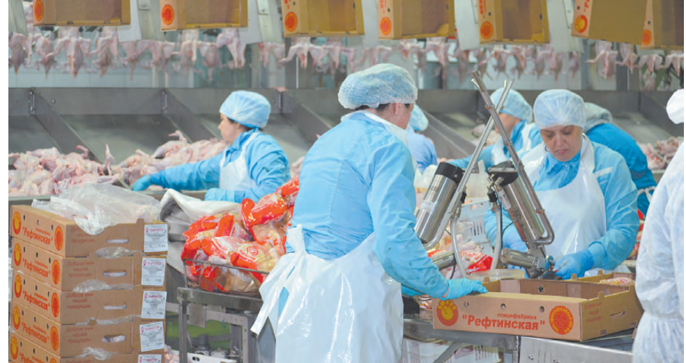
Продукцию пакуют и отправляют на реализацию.