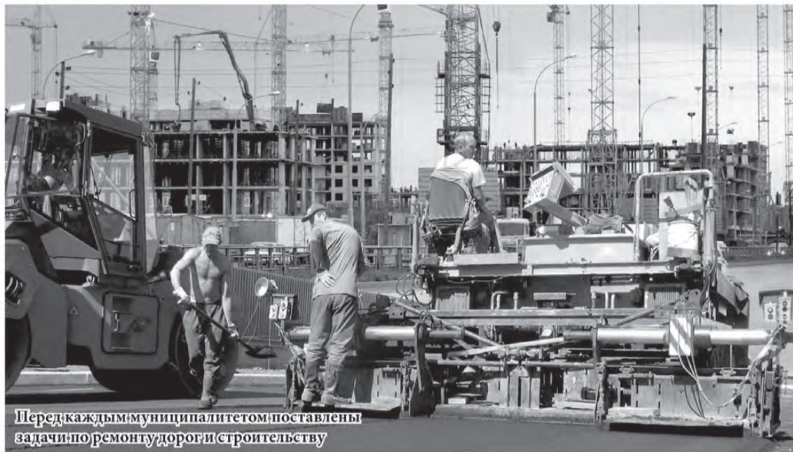
Перед каждым муниципалитетом поставлены задачи по ремонту дорог и строительству