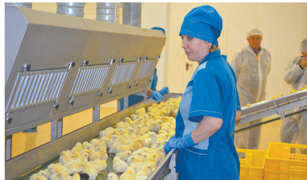
«Американские горки», или цыплята на конвейере.