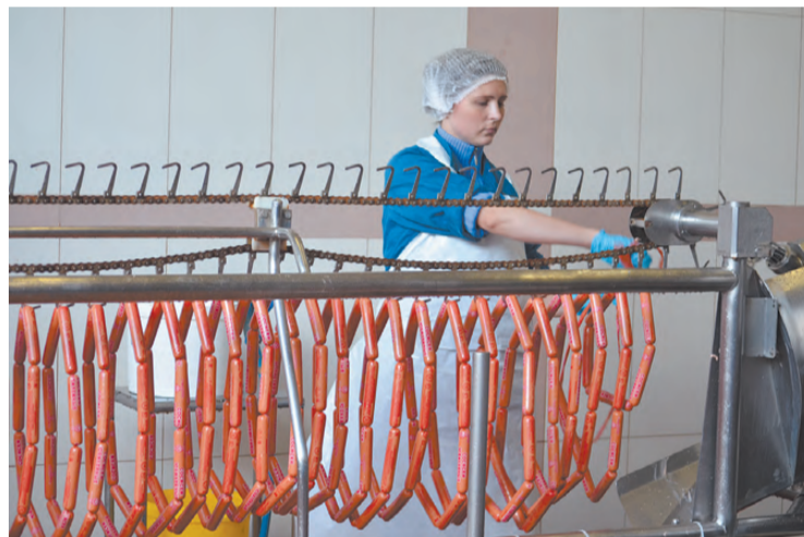
«Нашествие» журналистов не прерывает процесса, хотя несколько смущает работников фабрики.