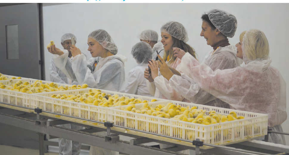
Всеобщий восторг вызвали недавно вылупившиеся цыплята.