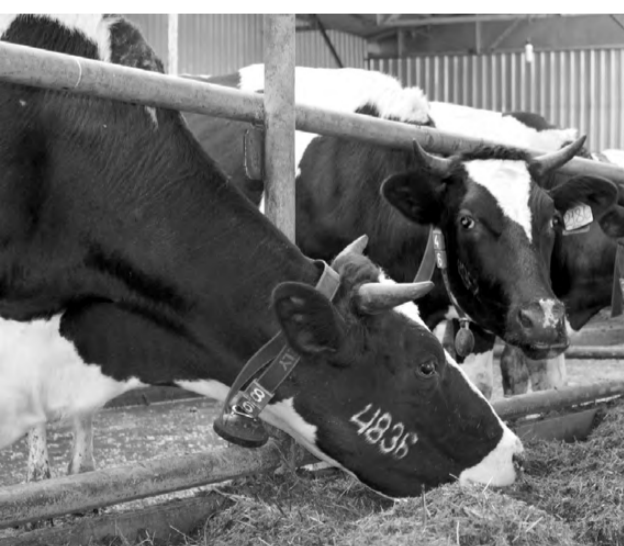
Сейчас большинство корпусов и ферм области заполнены, для увеличения поголовья необходимо строительство новых.

- Существующие корпуса и фермы заполнены практически максимально, а строить новые с каждым днём становится всё накладнее, - отметил С. Шарапов. - Стоимость строительства корпуса на 200 голов привязного содержания с оборудованием стоит около 30 млн. рублей.