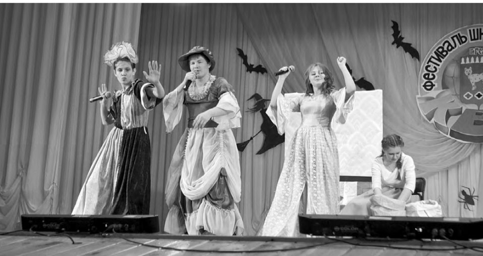
«Золушка» в интерпретации «Трудного возраста» превратилась из сказки в клубную вечеринку.