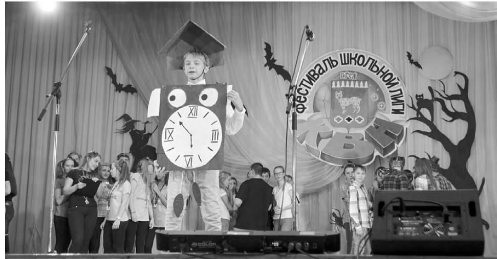
Вместо «ку-ку» - «бадя-бадя»! Часы от команды «Без галстуков» школы №7.