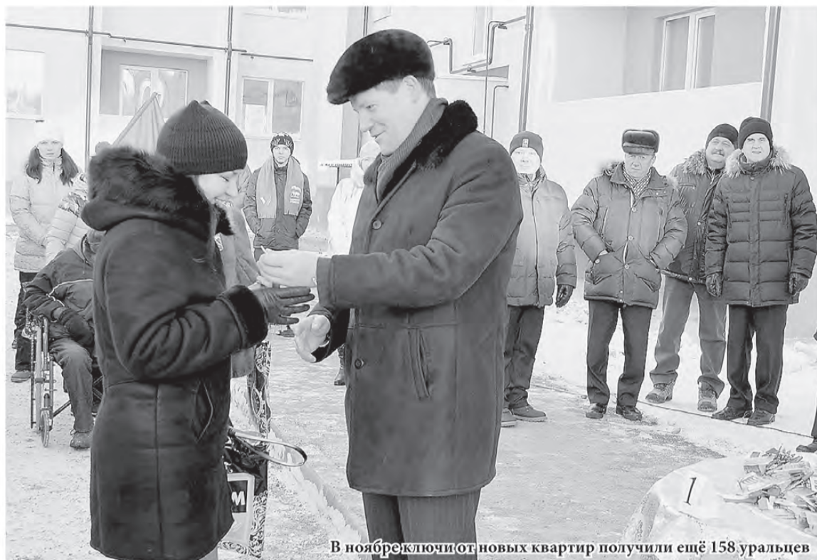
В ноябре ключи от новых квартир получили ещё 158 уральцев

Данное решение приняло федеральное правительство.