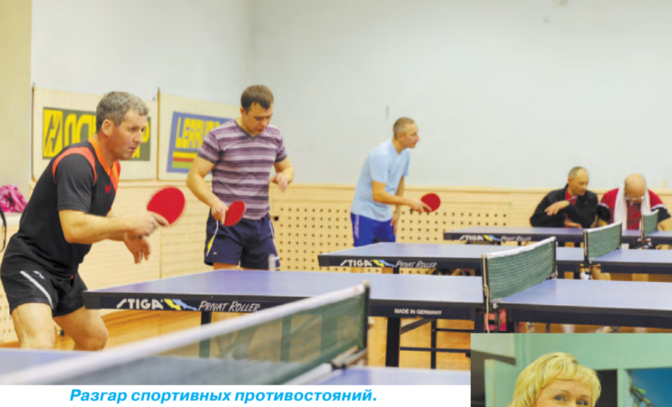
Разгар спортивных противостояний.

В ноябре в спортзале ЦКИ г. Режа проводился матч-турнир «Кубок Артура» между сборными командами городов Реж и Артёмовский по настольному теннису.