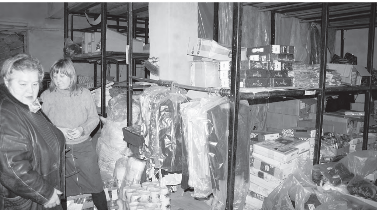
Режевское РАЙПО будет сдерживать рост цен на некоторые товары за счёт складских остатков.

Повышение цен на некоторые продукты стало неприятным сюрпризом для жителей села Останино. Селяне пожаловались в редакцию газеты на то, что стоимость риса в магазине РАЙПО увеличилась после Нового года с 28 до 64 рублей.