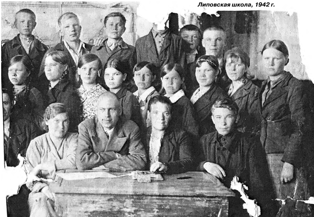
Липовская школа, 1942 г.