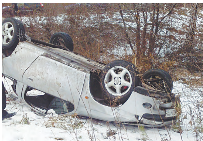
Машина, слетев с дороги на большой скорости, несколько раз перевернулась.

Как сообщили в ОГИБДД ОМВД России по Режевскому району, свадьба возвращалась в Реж после фотосессии в деревне Першино. Водитель «Opel Tigra» - 26-летняя девушка с водительским стажем 1 год 11 мес., следуя в составе свадебного поезда в конце колонны, решила совершить обгон, однако, обогнав впереди идущие машины, не справилась с управлением. В результате автомобиль вылетел с трассы и несколько раз перевернулся. В момент аварии в салоне находились четверо человек. От сильного удара водителя и двух пассажирок выбросило из машины. Все получили травмы различной степени тяжести. Одна девушка (1988 года рождения) скончалась на месте ДТП до прибытия скорой помощи. Пассажирка, находившаяся на переднем сидении иномарки, была пристёгнута ремнём безопасности. Она получила незначительные травмы.