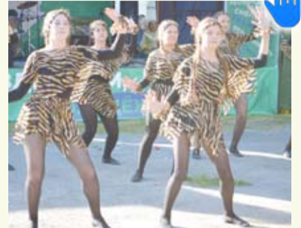
В ГО Богданович с размахом прошел День молодежи.