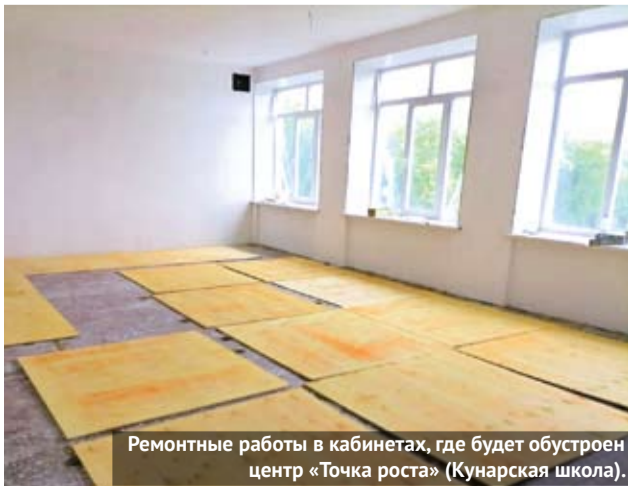
Ремонтные работы в кабинетах, где будет обустроен центр «Точка роста» (Кунарская школа).

В рамках программы «Доступная среда» выпол-