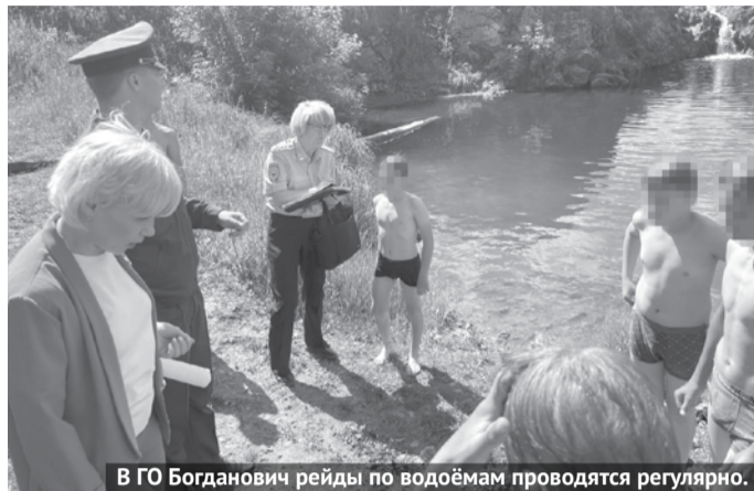
В ГО Богданович рейды по водоёмам проводятся регулярно.

В Свердловской области по поручению Евгения Куйвашева усилена работа по профилактике несчастных случаев на воде. В каждом муниципалитете ведется мониторинг обстановки на водоемах