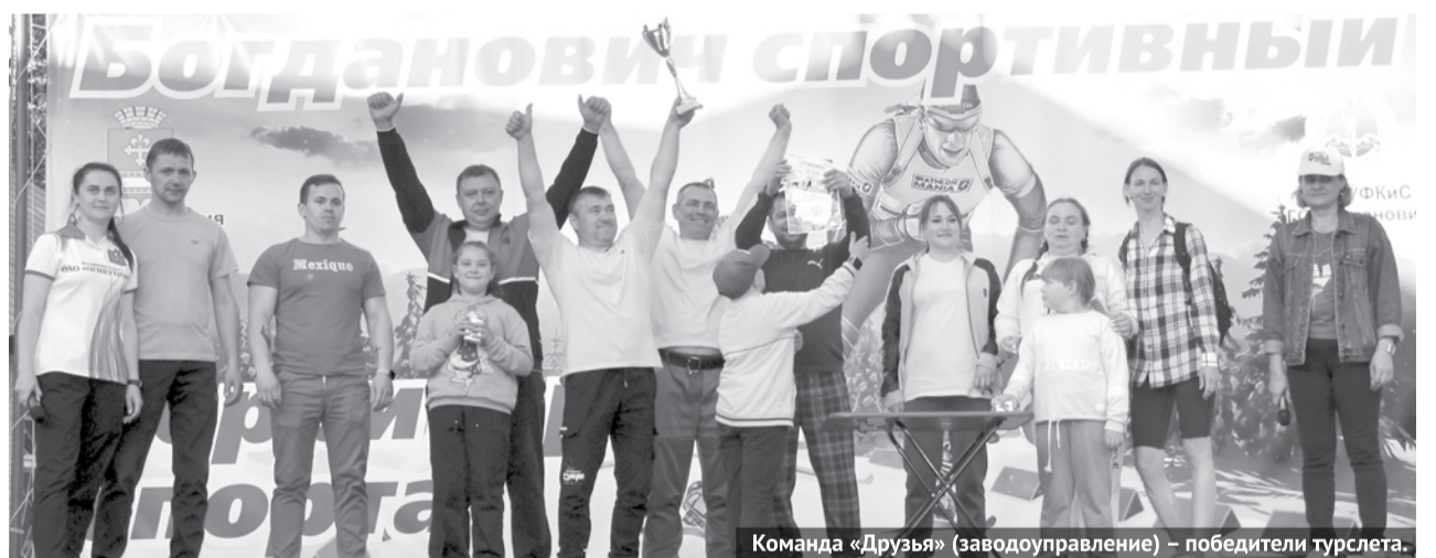
Команда «Друзья» (заводоуправление) – победители турслета.

примечательностях и известных людях Богдановича. После представления команд на сцену вышли их лидеры, чтобы сразиться в конкурсе капитанов. Им необходимо было ответить на ряд вопросов, которые также требовали самых разных знаний о нашем городе. Например, кто помнит, какой год написан на здании ДКЦ? Вот и я не сразу вспомнила... А время на ответы ограничено.