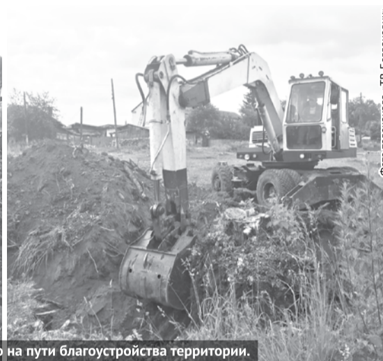
Выкорчевывание пней после расчистки парка от возрастных тополей – это только начало на пути благоустройства территории.