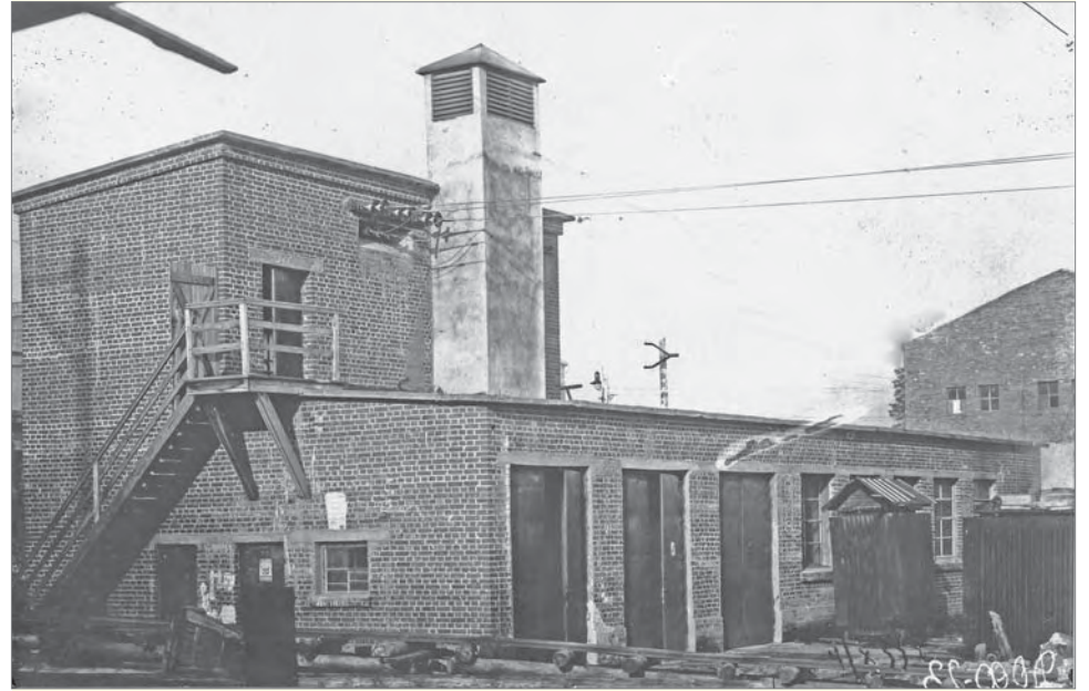
Первая подстанция завода, пуск состоялся в мае 1932 года.