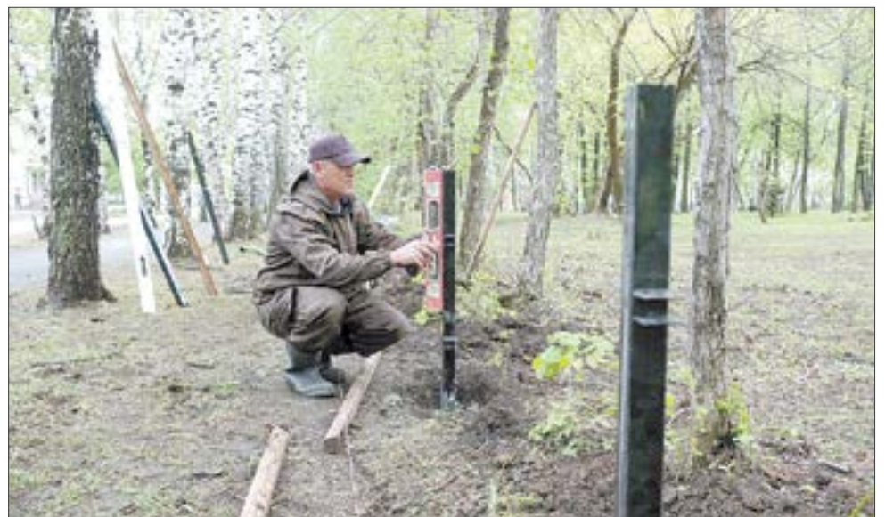
В парке Победы начали устанавливать новый забор. Он выполнен в той же стилистике, что и остальные объекты парка.

Что касается парка Победы, то работы там уже идут не первый год. Этим летом в парке приведут в порядок сектор, который идет параллельно улице Чайковского. Там появятся мемориальные плиты, выставка военной техники, тротуарные дорожки, освещение, урны и скамейки. Сейчас подрядчик — ИП Гамзаев — готовит площадки под будущую экспозицию, а также намечает, где будут проходить тротуары.