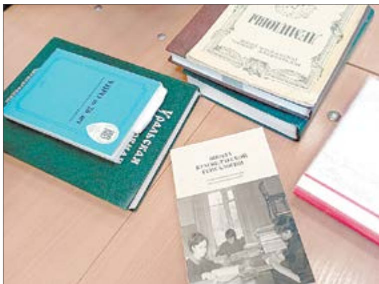
Много материалов и источников, от которых можно оттолкнуться в начале поисков, есть в фондах библиотеки имени Пушкина.