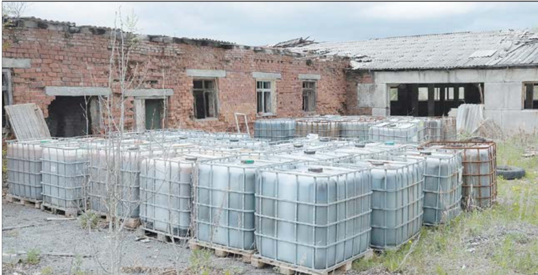
Всего на территории старого коровника разместили 38 еврокубов, в которых порядка 40 тонн маслянистой жидкости с запахом кислоты.