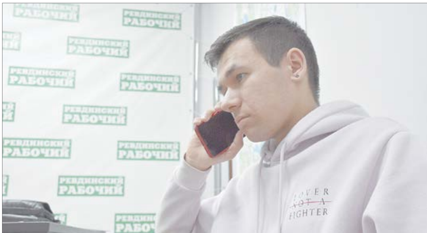
Дозвониться до диспетчерских служб нашего города реально. До всех, кроме МРСК.

Через 10 минут после звонка поток воды прекратился. Значит, служба оперативно взялась за работу и справилась с проблемой. Но всё же долгий