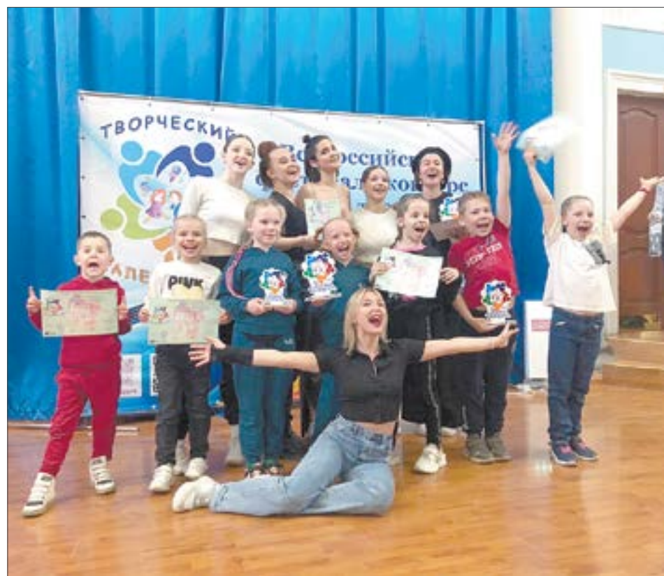
Фото танцевального коллектива «Чердак»