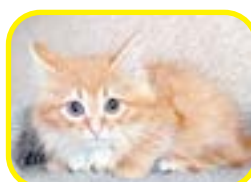
Милые рыжик, девочка и два мальчика.