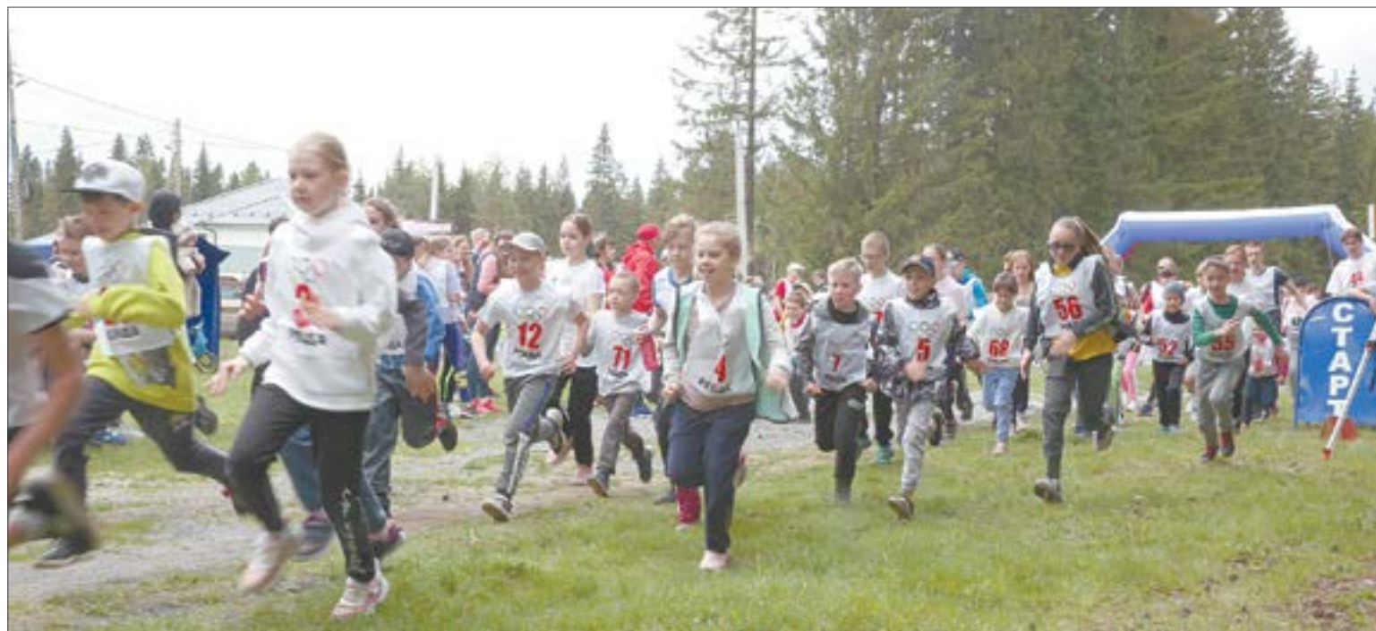
В первом забеге на 1 км бежали в основном дети. На старт вышли 60 человек.

По информации фонда, за время акции было собрано более 66 тысяч рублей. Эти средства позволили завершить сбор для участницы проекта «Ты ему нужен» Кати Спиридоновой. Для нее купили иппотренажер.