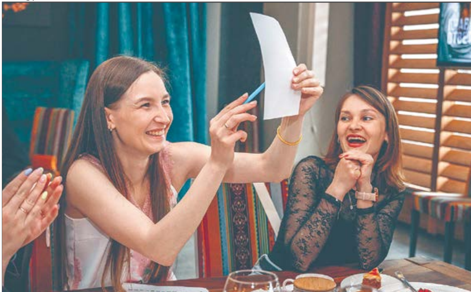
Пожалуй, одно из главных преимуществ игры разума «IMOM'S» — настроение. Оно у нас всегда на высоте. Как и вопросы, в которых зачастую важны не знания, а логика.