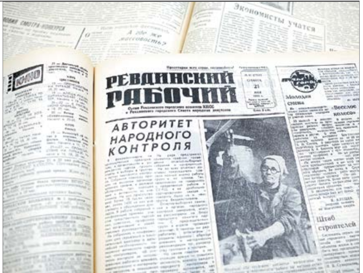
В майских выпусках «Ревдинского рабочего» 1983 года огромное количество публикаций посвящено благоустройству города.