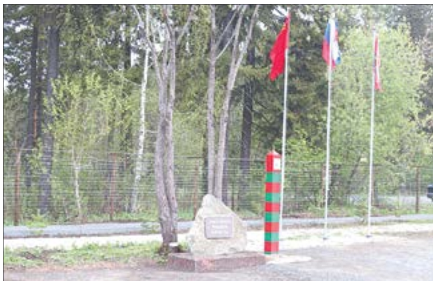
«Площадка воинской славы» расположена у Гусевской дороги, в конце улицы Мира. Раньше это была стихийная автостоянка с пьяными людьми, а сейчас здесь занимаются многие жители района. // Фото «Стражей границ»

В Ревде около 2000 ветеранов-пограничников. И они занимаются не только патриотическим воспитанием, но и другими полезными делами. // Фото «Стражей границ»