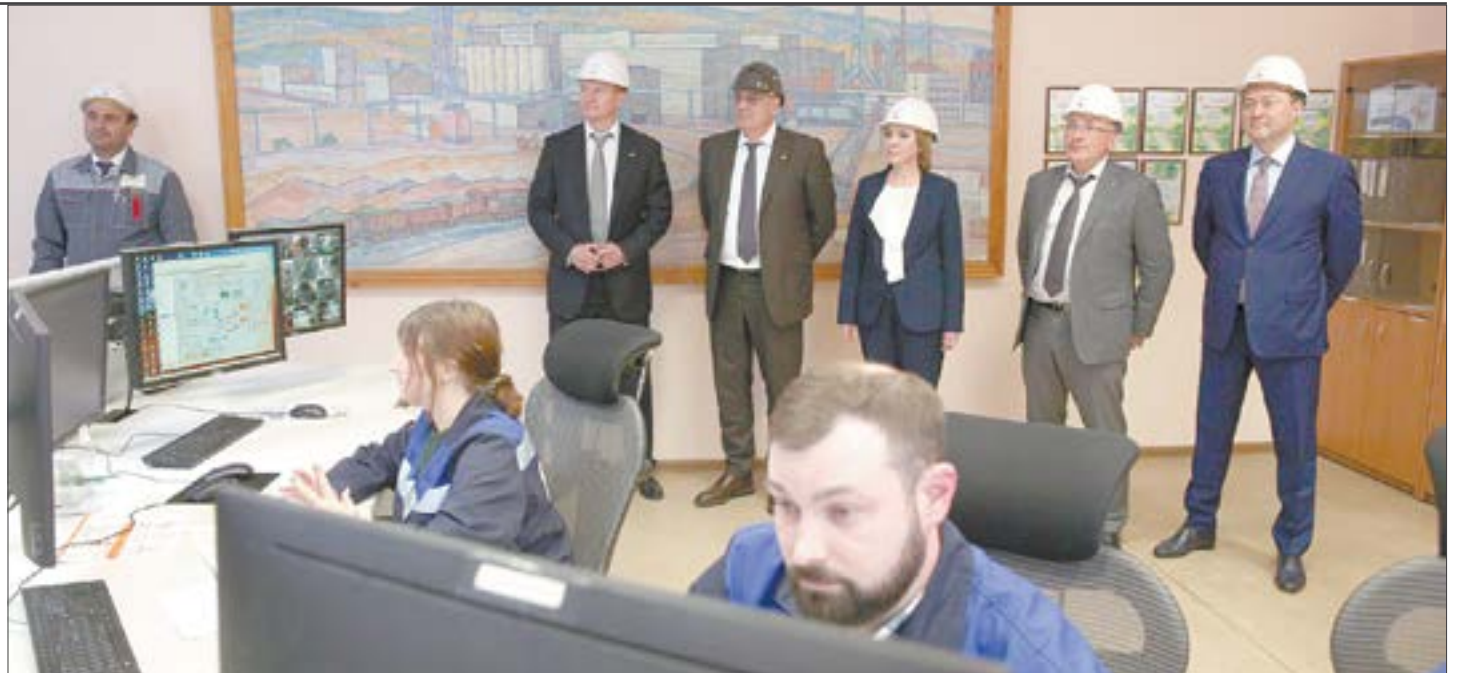
Момент, когда сернокислотный цех выдал десятиmillionную тонну, и почетные гости, которые за ним наблюдали.

На СУМЗе 26 мая была выдана 10-миллионная тонна серной кислоты. Именно такое количество продукции произвел новый цех серной кислоты (ЦСК) со дня ввода в строй — с 25 октября 2009 года.