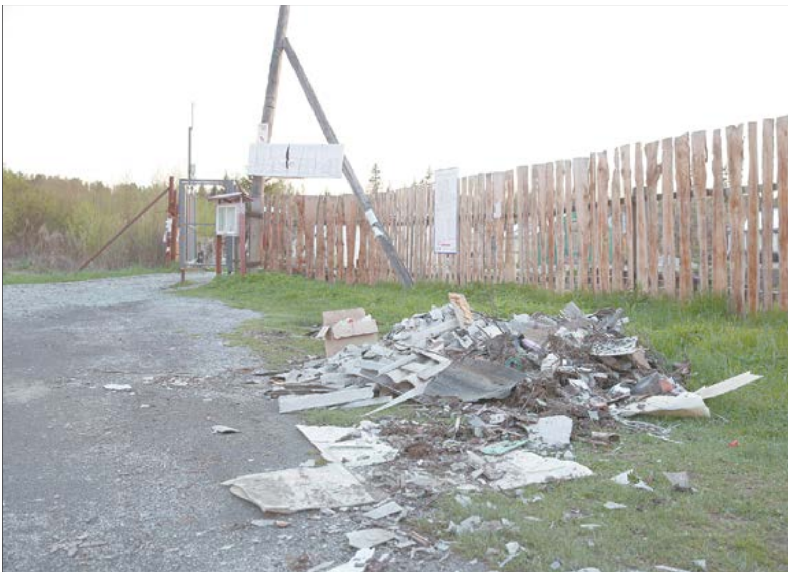
Куча раздора появилась за воротами сада «Зари 4» 22 мая. Председатель сада говорит, что здесь — мусор после субботника. «Экосервис» — что шифер, вывозить который на полигон они не имеют права.

Это не капризы регионального оператора и не жажда наживы.