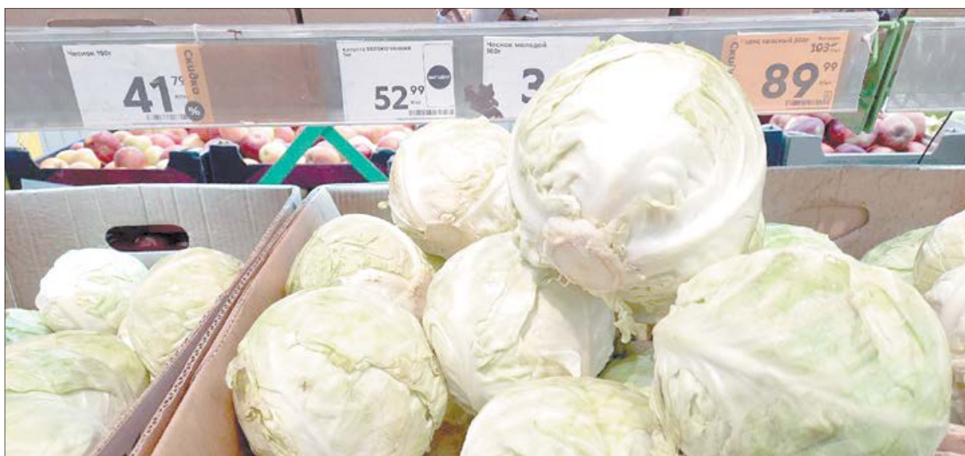
Капуста в этом месяце стала рекордсменом по изменению цены — почти 34%. А главное — она подешевела.