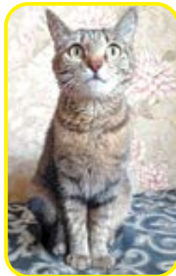
Молодая стерилизованная кошечка. Ходит в лоток с наполнителем.