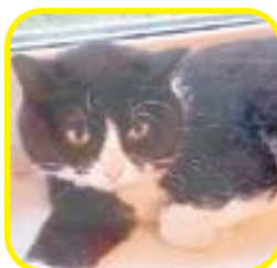
Скромная ласковая кошечка. Стерилизована, с лотком порядком.