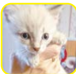
Малыш-мальчик в добрые руки.