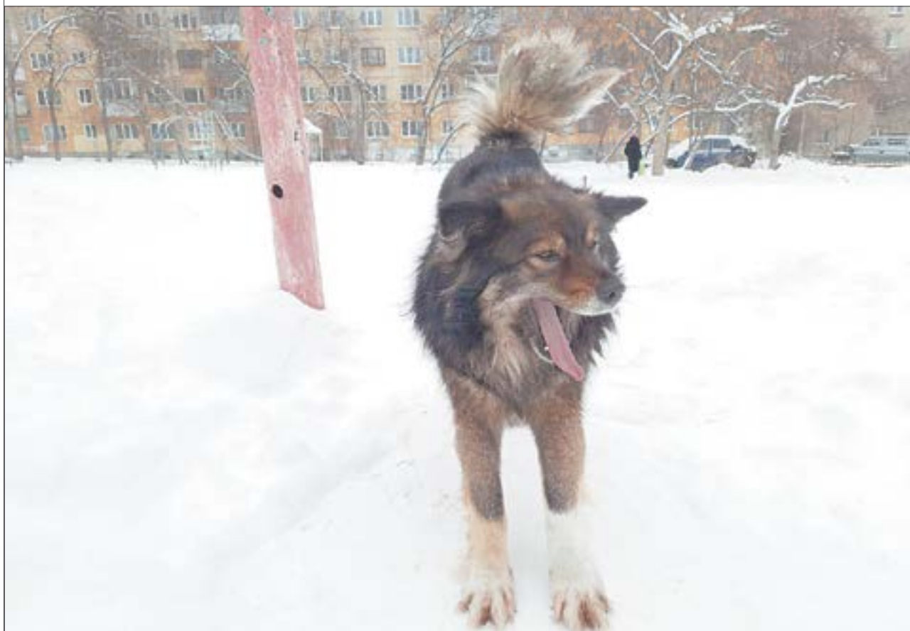
При встрече с бродячей собакой, прежде всего, нужно обратить внимание на её поведение. Возможно, ей вообще будет не до вас.