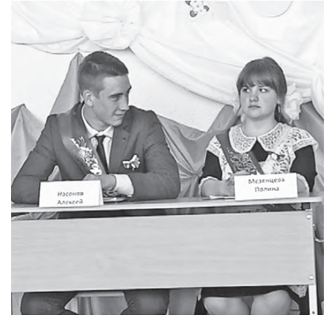
В школе №14 выпускной был очень душевный