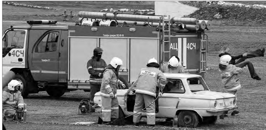
Эвакуация пострадавших.