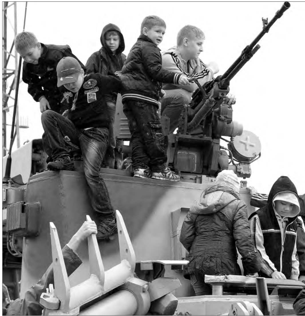
Ребятышки знакомятся с новой техникой.