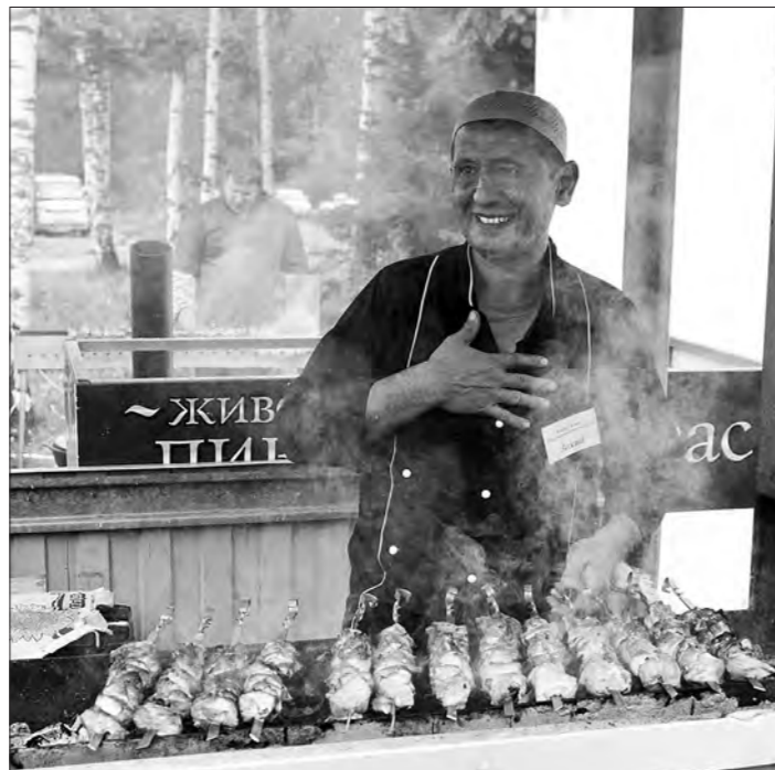
На выставке угощали вкусным шашлыком.

В рамках выставки состоялась демонстрационные показы боевых и эксплуатационных возможностей техники, а также действий служб спасения.