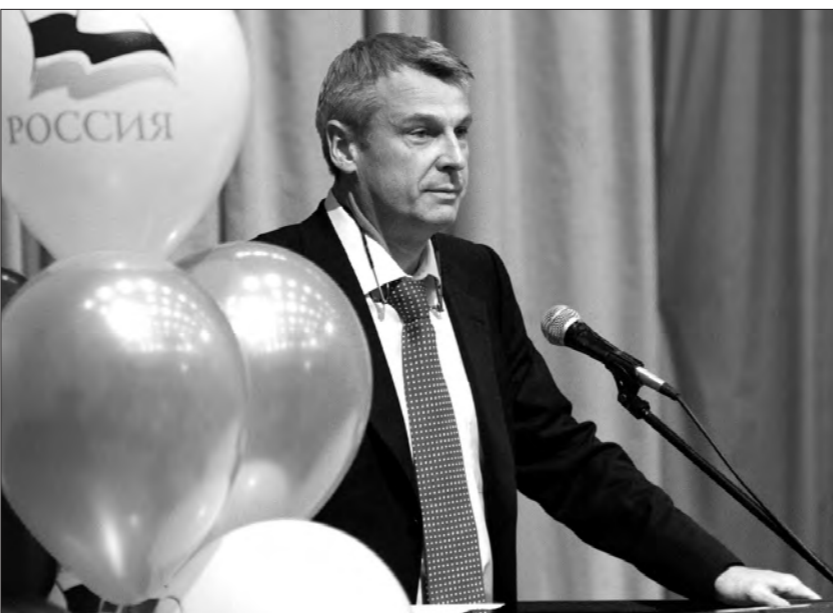
Выступает вице-губернатор Сергей Носов.