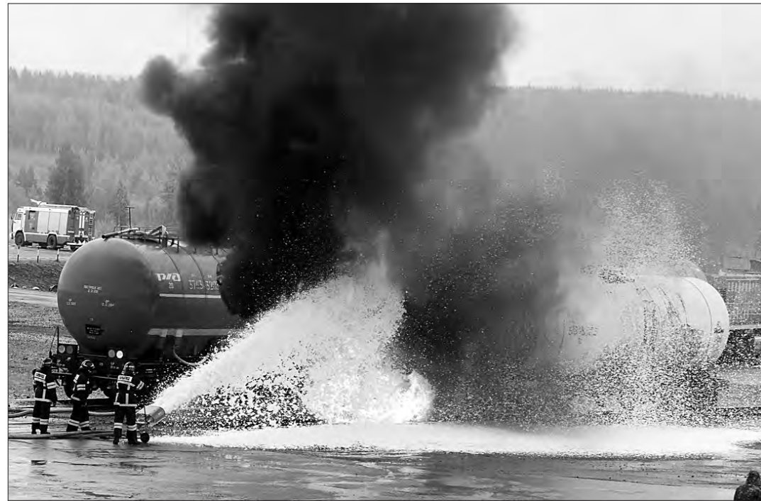
Тушение горячей цистерны.