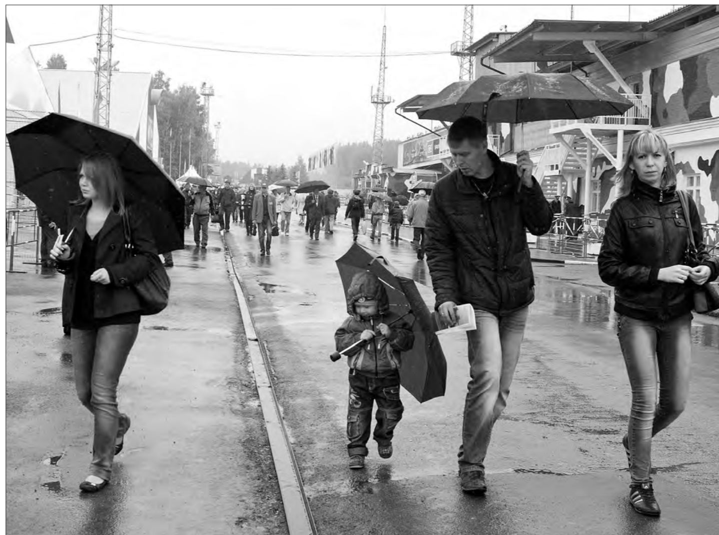
В последний день выставки.

VII Международную выставку технических средств обороны и защиты Russian Defence Expo-2012, которая проходила в Нижнем Тагиле с 22 по 25 августа, посетили свыше 25 тысяч человек, об этом сообщил генеральный директор ФКП «НТИИМ» Валерий Руденко.