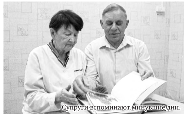
Супруги вспоминают минувшие дни.