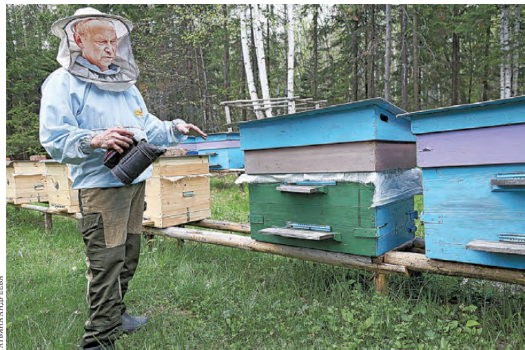
Путешествие по будущей велосипедной тропе начнется от расположенной неподалеку пасеки «Благодать».