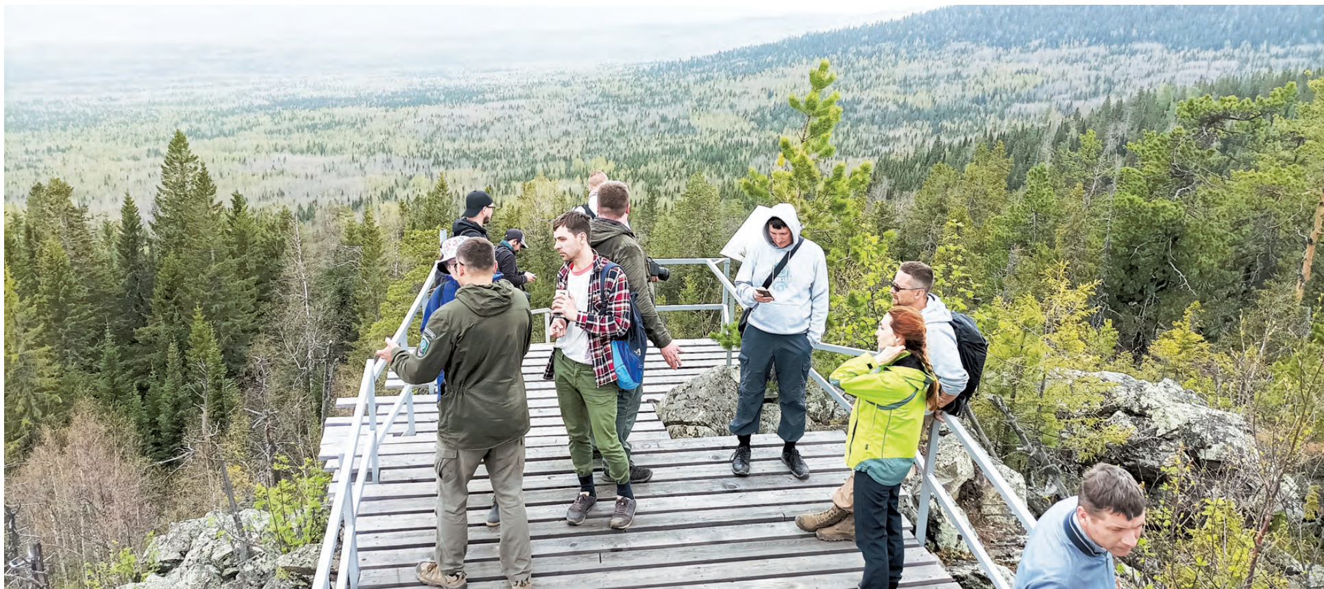
Со смотровой площадки до горизонта — первозданный темнохвойный лес, в том виде, каким он был тысячу лет назад.

ЭКСПЕРТНЫЙ совет при Ростуризме присвоил Демидовскому маршруту статус национального. В новом качестве его запустят ко Дню России. Протяженность маршрута — 329 километров, он пройдет через Екатеринбург, Невьянск, Верхние Таволги и Нижний Тагил. Путешествие рассчитано на три дня и две ночи. До сих пор статус национального маршрута в Свердловской области имел тур в императорском вагоне из Екатеринбурга в Алапаевск.