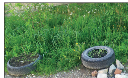
А жители продолжают использовать шины для благоустройства своих дворов. Пора менять подход к озеленению придомовой территории

С 2021 года на законодательном уровне запрещено также использовать автошины для «украшения» дворов. Закон запрещает организовывать клумбы и вырезать лебедей и другие замысловатые фигуры из автошин.