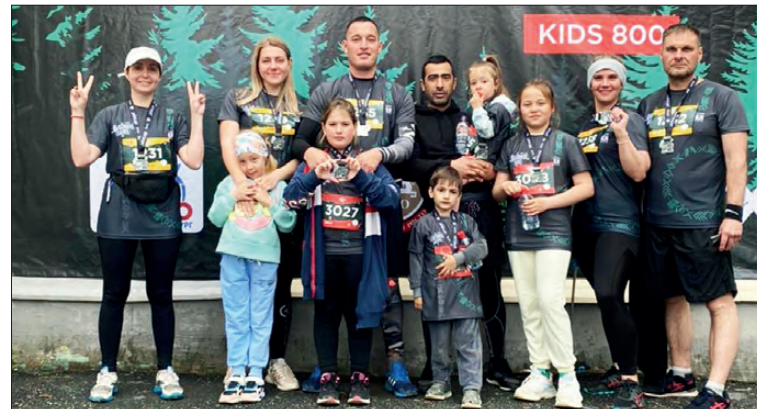
Трасса «Шигирского Идола» покорила дегтярским любителям бега

– Бежали здесь же в прошлом году – есть с чем сравнить. Организация трейла стала лучше, дизайн медали и футболок – просто огонь. Трасса хорошая, дожди добавили экстрима, вокруг красота,