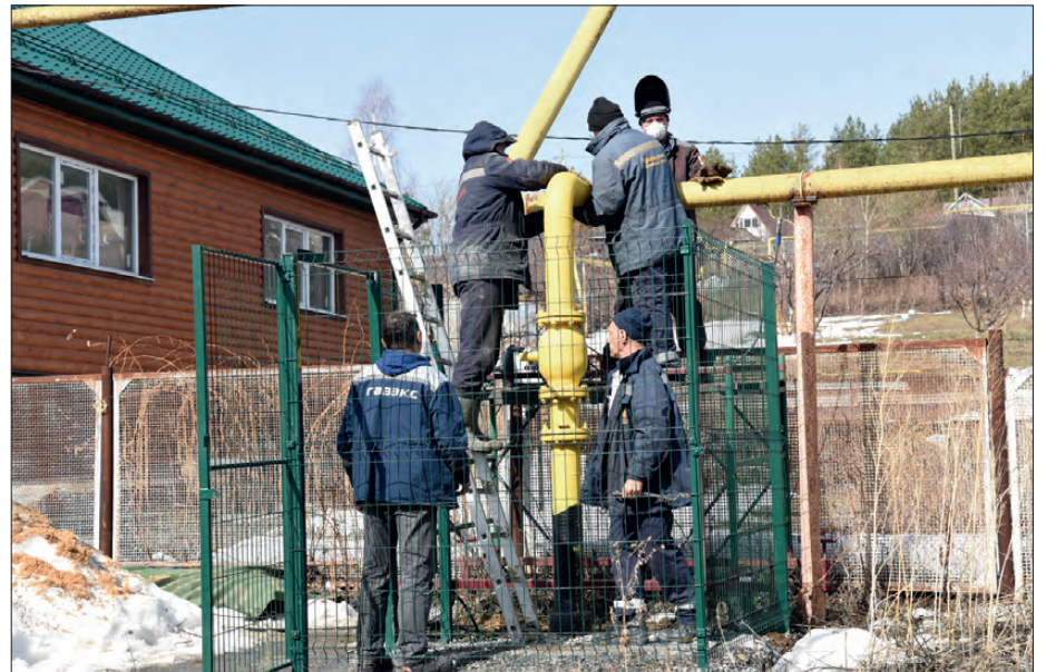
На улице Чернышевского специалисты Ревдинского горгаза в мае успешно выполнили врезку в газопровод.

По состоянию на 20 мая 2022 года в нашем городе было зарегистрировано 324 заявки. Не газифицировано еще 1635 домовладений. Заключены договоры на проектно-изыскательные работы для строительства распределительных газопроводов низкого давления про-