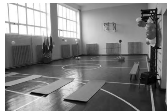
Спортивный зал Харловской школы после ремонта по федеральной программе.

В Свердловской области в сельских школах к новому учебному году отремонтируют спортивные залы. Решение о выделении дополнительных средств принято на заседании регионального правительства, которое прошло под руководством губернатора Евгения Куйвашева. В общей сложности в 2022 году из федерального и областного бюджетов на реконструкцию в рамках нацпроекта «Образование» выделено более 20 миллионов рублей.