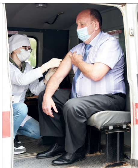
Даже на празднике «Сабантуй» медики прививают желающих в мобильном пункте

Вообще, сотрудники очень достойно переносят все те невзгоды, те колоссальные трудности и нагрузки, с которыми вынуждены встречаться. Вот уже 1,5 года не работает грузовой лифт в корпусе, где