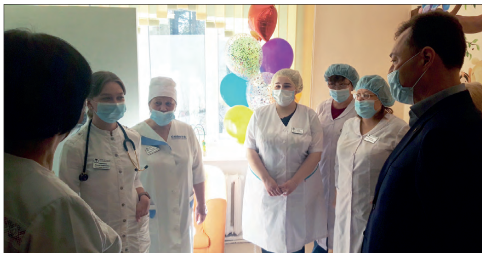
Открытое после реконструкции детское отделение