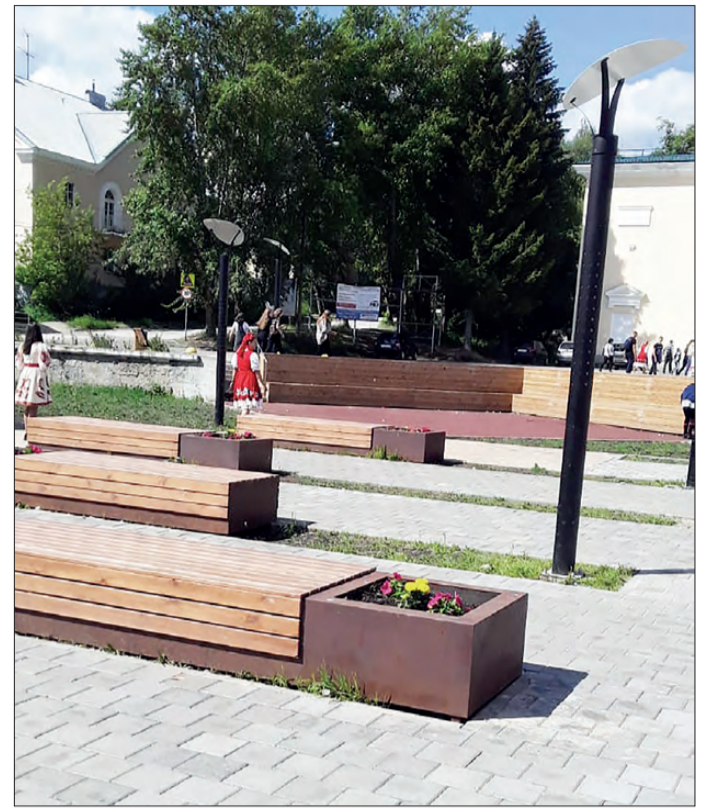
Продолжается реконструкция главной площади нашего города, которая уже стала для многих дегтярцев любимым местом отдыха

просто территорией для отдыха, а средообразующим общественным пространством, где будут сосредоточены зоны тихого отдыха, площадки для занятий спортом, детского отдыха и многое другое. Для достижения этого проект разбит на три этапа, выполнение будет идти в зависимости от финансирования, выделяемого в случае успешного прохождения заявки по сформированной документации.