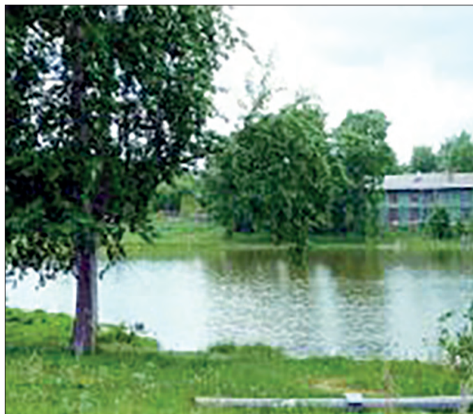
Территория старого пруда ждет своего обновления

Формирование достойного облика нашего города — непростая работа. Новый объект благоустройства должен стать не