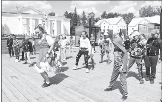
На снимках: фольклорный праздник «Русские забавы»

отдохнут более 430 тысяч детей. В течение последних десяти лет в регионе действует программа по предоставлению субсидий на проведение ремонтов в загородных муниципальных лагерях — по 100 миллионов рублей ежегодно.