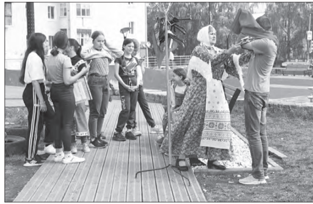
лагеря — самые доступные и популярные. По всему региону их сегодня 1060. Везде должны быть лучшие условия для детей.

лето под спальни для младших школьников, здесь называют «бунгалло». Дети в школе рисуют, танцуют, гуляют, ходят на экскурсии — словом, всё, что положено делать школьникам, чтобы провести каникулы с пользой.