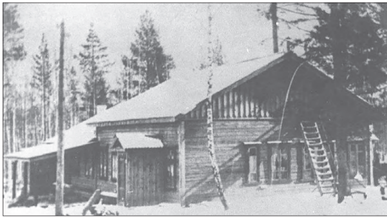
Хлебозавод, 1937 год

В 1936 году образован Дегтярский куст (группа объединенных промышленных предприятий) хлебопечения Ревдинского хлебокомбината, включавший в себя пекарни, столовую, склад, ларек, буфет. В 1941 году создан Дегтярский хлебокомбинат Свердловского треста «Росглавхлеб». Когда началась война, началась мобилизация и на Дегтярском хлебозаводе. Все мужчины уходили на фронт, их заменяли женщины. С тех пор на многие годы коллектив хлебопекарного завода оставался сугубо женским.