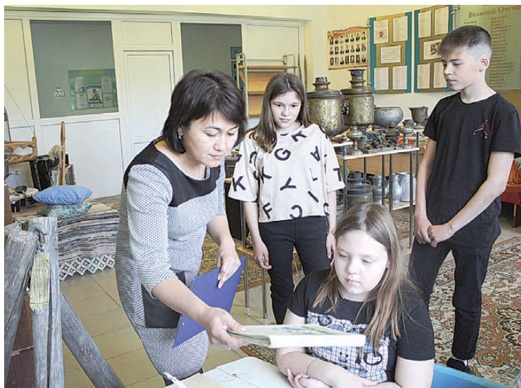
После ремонта обновится и музейная комната. Сейчас здесь довольно тесно, а экспонатов очень много.

ние и стены довольно крепкие, поэтому, согласно экспертизе Главного управления строительства, ситуацию исправит годовой ремонт.