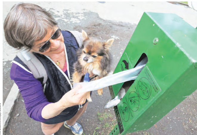
В Екатеринбурге дог-боксы установили в парке имени Маяковского.