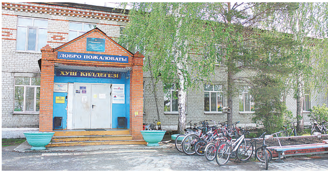
По заверениям представителей района, в капремонте Чикчинская школа остро не нуждалась, поскольку не аварийная, но родителям пошли навстречу. Стало быть, и они должны потерпеть ровно год.

Годами кабинеты и холлы просто красили да белили. Руководитель предупреждает: до швов на стенах и потолке лучше не дотрагиваться, иначе на голову посыплется крошка. Тем не менее сносить двухэтажку никто не собирается—ее основа-