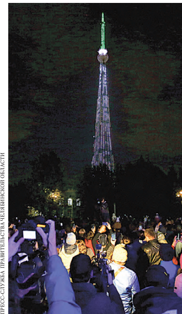
Челябинская телебашня стала одной из достопримечательностей города.