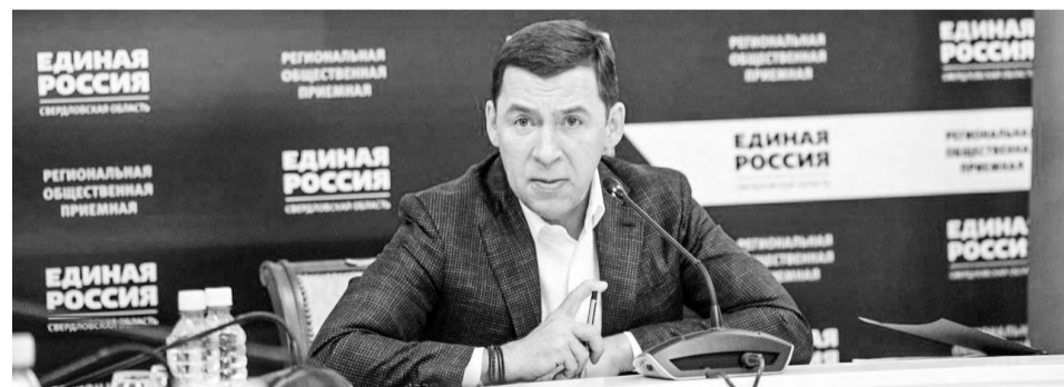
По информации департамента информационной политики Свердловской области.

НАПОМНИМ: сейчас до границ домовладений газ подводят бесплатно. За оборудование внутри участка хозяин должен платить сам.