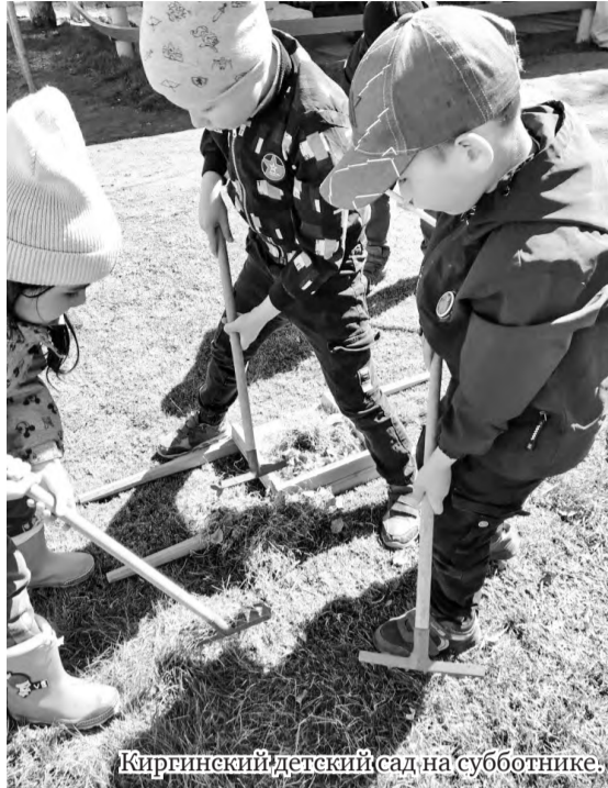
Киргинецкий детский сад на субботнике.

Благодарим всех участников экологического субботника «Зелёная весна – 2022» за проделанную работу.