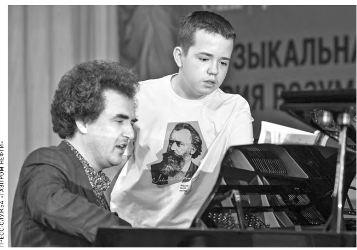
В «Музыкальной мастерской Юрия Розума» встретились признанные мастера и ямальские школьники.

Юрий Розум, профессор Российской академии музыки имени Пясиных, поделился впечатлениями: «В регионах живут уникальные молодые артисты и одаренные педагоги. Наша задача — поддержать их, ведь реализация таланта полностью зависит от взрослых, которые окружают юных музыкантов, опекают их. «Музыкальная мастерская» — это правильное окружение, проект, позволяющий обмениваться профессиональными навыками, знаниями, опытом, секретами мастерства и таким образом формировать новое сообщество профессионалов». К слову, «Мастерская» продолжает путешествие по стране. В этом году известные артисты проведут мастер-классы также в Ханты-Мансийске, Мысе Каменном, Тазовском и Омске. Поддерживать социальные проекты в регионах — главная цель программы «Родные города».