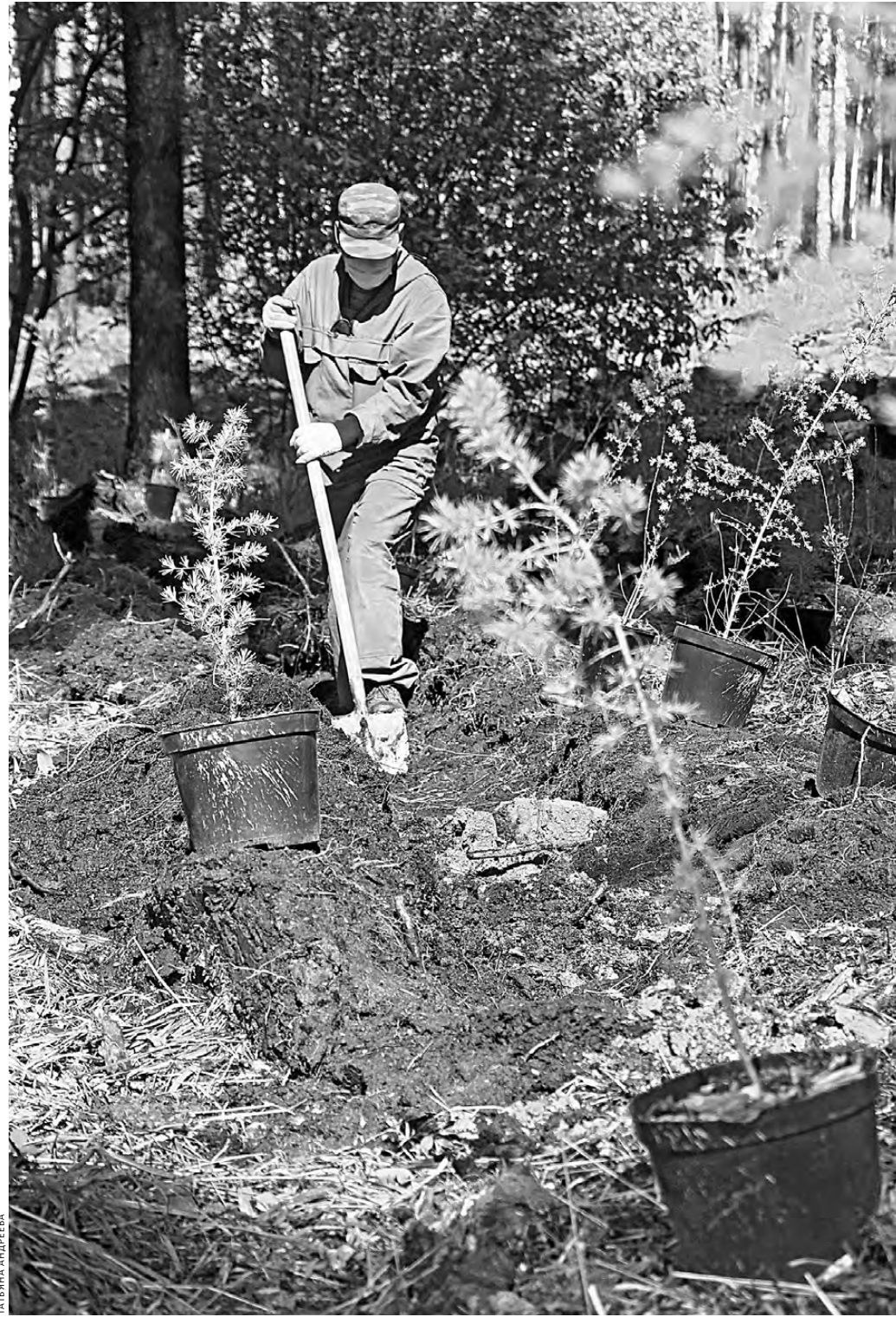
В этом году на лесовосстановление в Свердловской области направят 100 миллионов рублей.