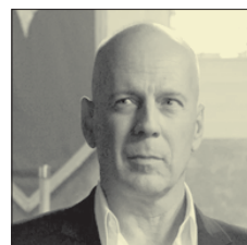
СТС • 23.00 «Неудержимые» (18+)