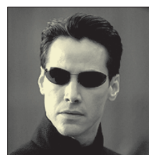
СТС • 22.45 «Матрица. Перегрузка» (16+)