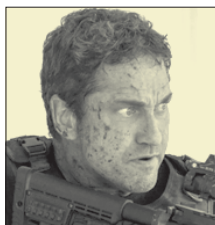
СТС • 19.35 «Падение ангела» (16+)