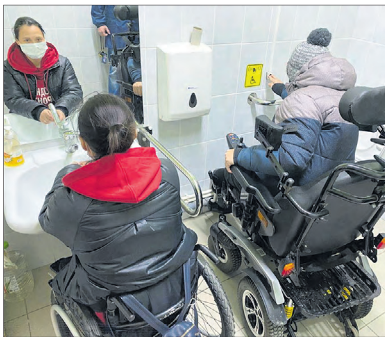
Представители «Народного фронта» намерены добиться, чтобы городская среда стала по-настоящему доступной, не только на словах.