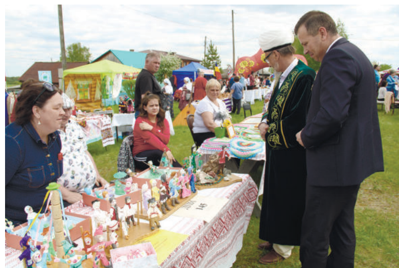
Не перевелись еще кудесники. Выставка уникальных изделий мастеров народных промыслов – зрелище воспитательное.