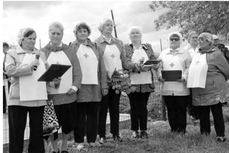
Скородумцы по случаю открытия нового ФАПа подготовили ответное слово.