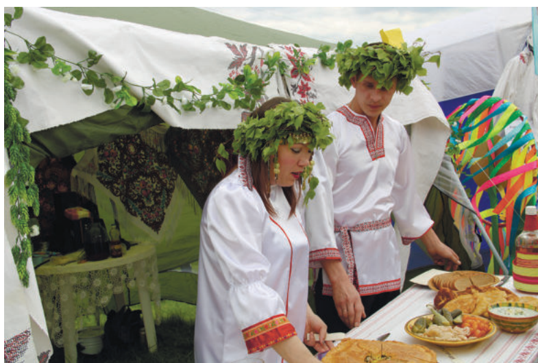
В национальных подворьях хлебосольные хозяйки угощали гостей яствами.