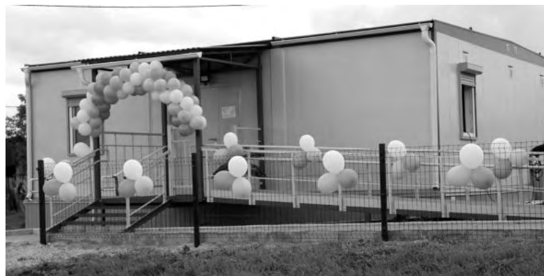
В Ирбитском районе открыт пятый модульный ФАП.

В распоряжении фельдшера дефибриллятор, телеэлектрокардиограф, комплект для ручной ИВЛ, ингалятор для проведения аэрозольной терапии. Установлено удобное для женских осмотров гинекологическое кресло, смотровые кушетки, а для детей – пеленальный столик. Для транспортировки пациента с травмой – комплект шин, одеяло с электроподогревом, спинальный мобилизационный щит.