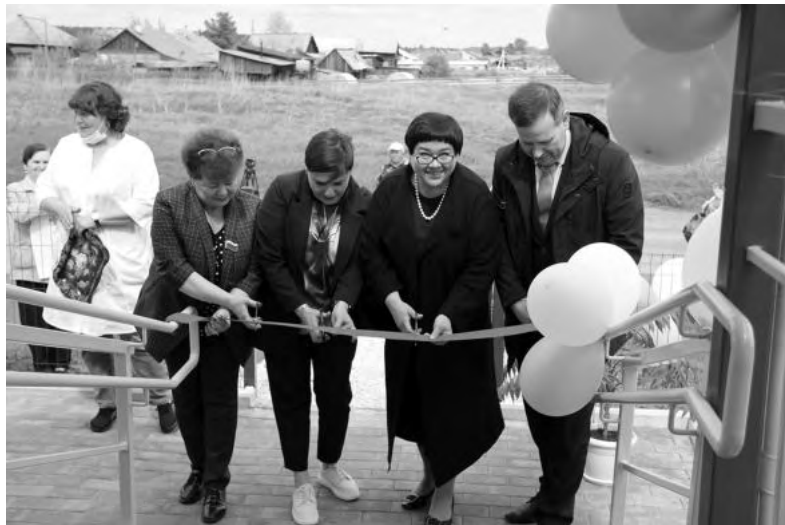
Модульный Скородумский ФАП официально открыт.

ФАП оснащен всем необходимым для оказания плановой, неотложной и экстренной помощи. Сельский медработник, имея экспресс-измерители глюкозы и холестерина, гемоглобинометр, спирометр, пульсоксиметр, тонометр для внутриглазного давления, секундомер, весы и ростометр, сможет производить контроль всех параметров и вовремя заметить отклонения здоровья у пациента.