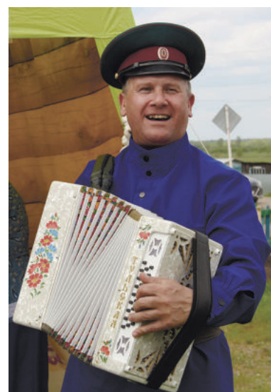
Гармонь – душа России.

состоялся седьмой областной форум «Духовно-нравственное воспитание детей и подростков». На научно-методическом семинаре эксперты, педагоги и студенты Ирбитского гуманитарного колледжа обсудили образовательные практики воспитания юных патриотов.