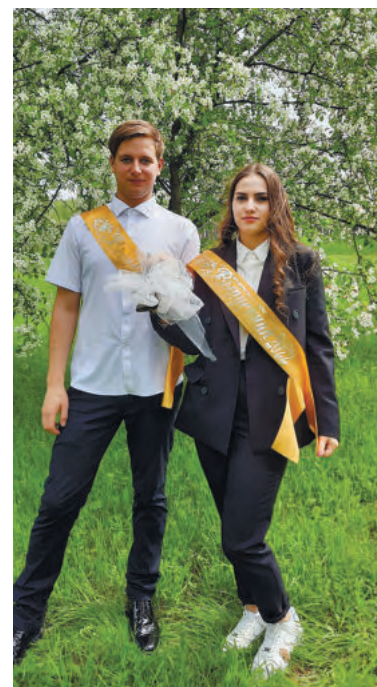
В цветущем школьном парке выпускники Дубской школы прощаются с детством!