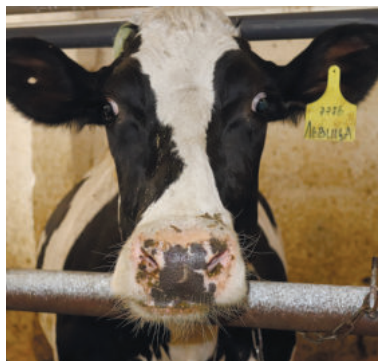
Подопечные приветствуют конкурсантов.

Соревнования среди техников-осеменаторов должны были состояться еще в мае 2020 года, но из-за распространения ковида они были перенесены до «безопасных» времен.