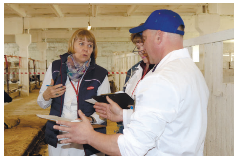
Судейская бригада подводит итоги выступления очередного участника.