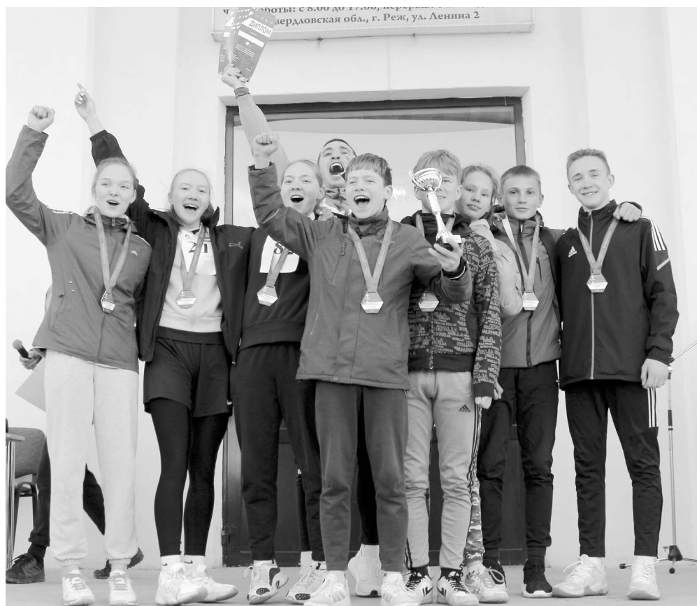
Отдельные поздравления команде школы № 2, для которой эта эстафета стала по-настоящему звёздной.

вместе. Это представители территориальных управлений по сёлам, работники организаций и учреждений, а также сборные команды. Среди ТУ беспорным лидером стала команда села Арамашка, эти спортсмены держали первенство и по отношению к командам других групп, участвовавших в общем забеге. Среди команд организаций и учреждений первой финишировала команда работников АО «Сафьяновская медь», буквально на 3 секунды им уступила команда Режевского политехникума. Ну и самой быстрой сбор-