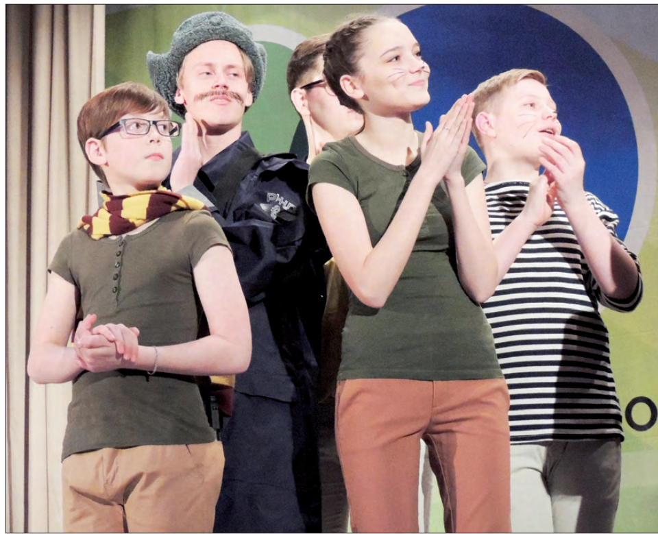
Окончание, начало на стр. 1

Девочки из команды «Шлагбаум» показали ностальгический сюжет для болельщиков старшего поколения «Пионеры в Советском Союзе» опять же скромно, позитивно, корректно.