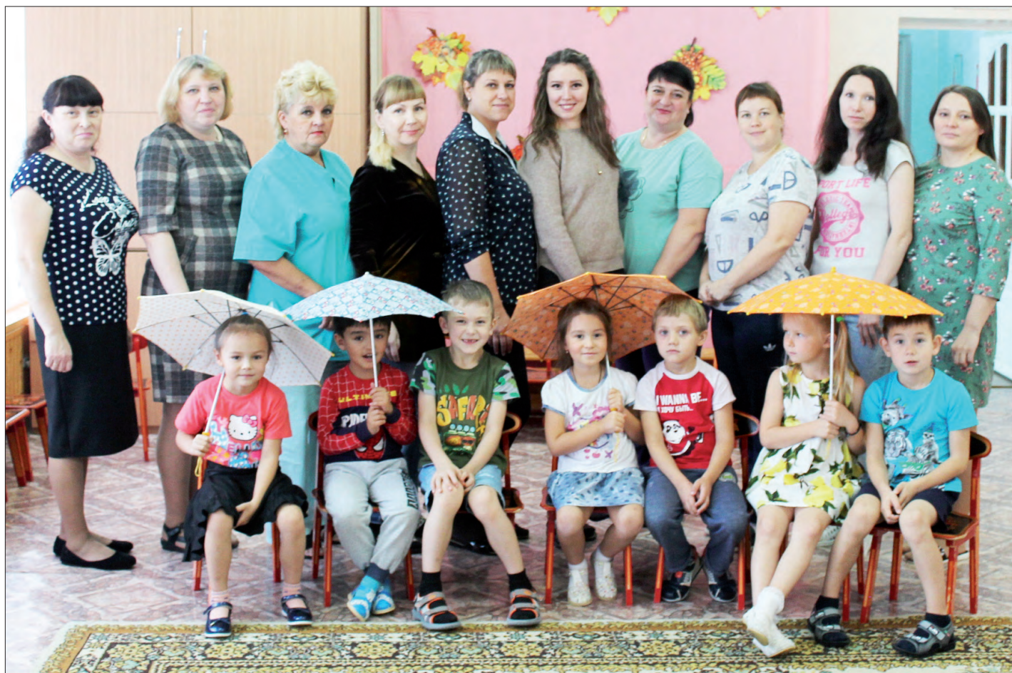
Коллектив детского сада №49

Прекрасная пора детства оставляет хорошие воспоминания, начиная с детского сада. И каждый, кто посещал дошкольное учреждение, помнит имя своего воспитателя. Работая с детьми, воспитатели учат их познавать мир, отвечают на самые разные непосредственные вопросы. Работе воспитателя по праву принадлежит свой день – День воспитателя.