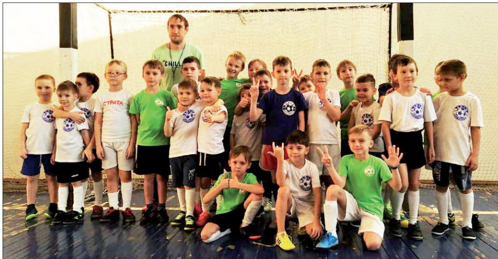
Младшая команда дегтярской ДЮСШ

В прошедшие выходные в спорткомплексе «Уралавтоматика», в преддверии новогодних праздников, прошли игры по мини-футболу среди юношей 2011-2012 и 2013-2014 года рождения. В гости к ребятам приехала команда ДЮСШ «Локомотив» из Екатеринбургa. Сначала в бой вступили старшие ребята. Игра была интересная, с обилием голевых моментов с одной и другой стороны. Только в конце матча нашей команде удалось склонить