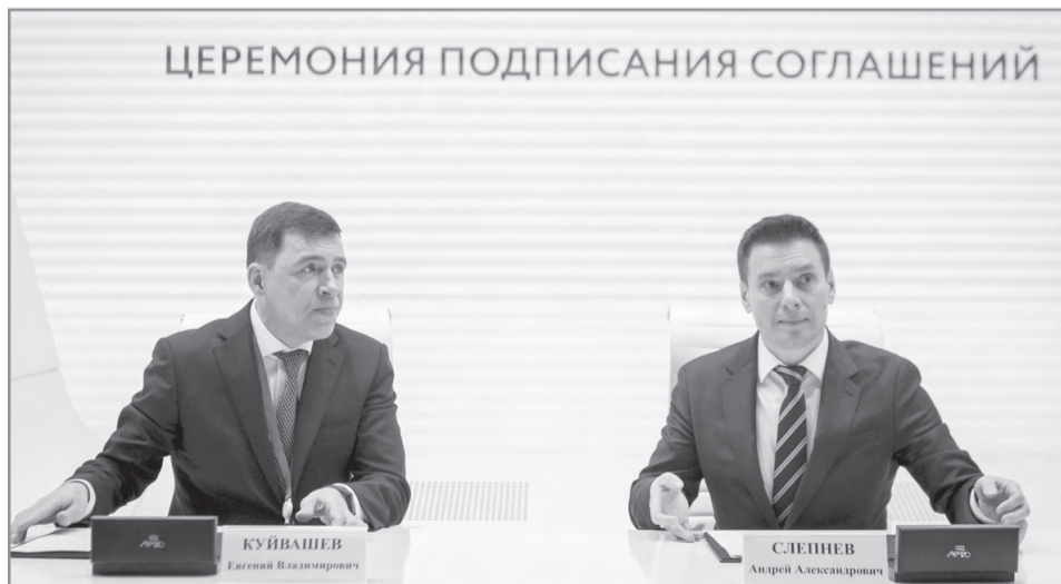
Губернатор Евгений Куйвашев 14 февраля на РИФ-2019 принял участие в подписании блока инвестиционных соглашений. Договоренности о привлечении в регион дополнительных средств достигнуты с Российским фондом прямых инвестиций, а также с Агентством инвестиций в социальную сферу.