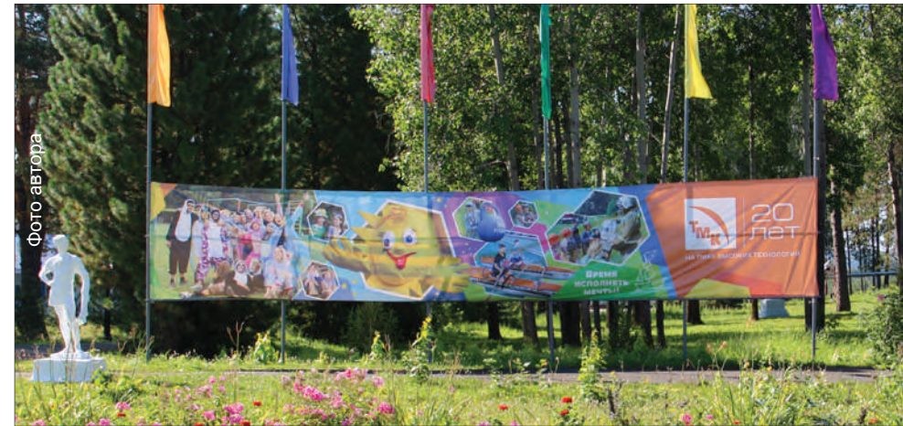
Сердце лагеря, место, где все отряды собираются на линейку. Такой её помнят многие поколения полевчан. Такой она уже не будет никогда. В этом году центр лагеря «Городок солнца» преобразится. Площадка теперь выложена тротуарной плиткой, но статуи остались на прежнем месте

Наполняемость лагеря по сравнению с прошлым годом выросла на сто человек благодаря дополнительным комнатам в новых корпусах и снятию ограничений на количество прожива-