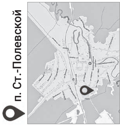
п. Ст.-Полевской у Дома культуры

и ул. Бажова), Штанговый пруд (ложбина северного берега), береговая полоса Глубочинского пруда. Будут обработаны территории у родников Калининского, Штангового, у коллективного сада «Родничок» (по полдневской дороге).