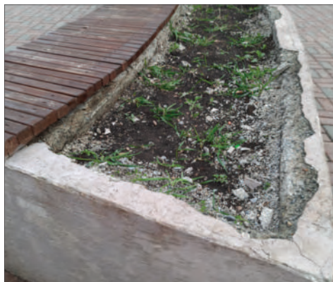
На улице Трояна восстановительные работы начались ещё до обследования: меняются люки, деревянные конструкции, на очереди – приведение в порядок бетонных клумб и замена плитки

Лучше всех сохранилась аллея, ведущая в Берёзовую Рошу. Тут необходимо заменить поломанные сливные решётки, подкрасить урны и привести в порядок одну скамейку.