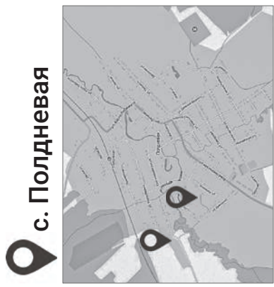
с. Полдневая З. Бор, поляна в конце ул. Карла Маркса

В городской черте южной части под обработку попадают парк, гора Думная, стадион на ул. Красноармейской, аллея за ЦРТ им. П.П. Бажова, территории у родников Калининского, Штангового, у коллективного сада «Родничок» (по полдневской дороге).