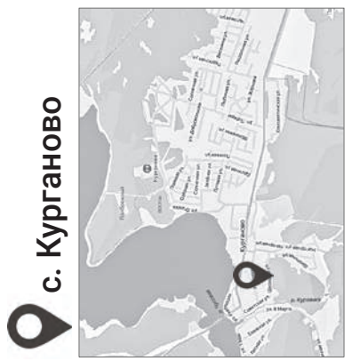
с. Курганово Вдоль лесного массива напротив школы

«Азов», территории лыжной базы ФСК СТЗ, микрорайона З. Бор-1 в районе домов № 1, 2, З. Бор-2, в районе домов № 2, 3, 33, 34, от ул. Декабристов до дома № 19 мкр. З. Бор-1, лесополосы вдоль ул. П. Морозова (от ул. Декабристов до ул. Жилой), зона отдыха у стелы