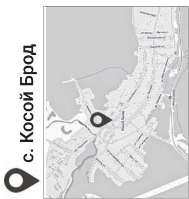
с. Косой Брод Место проведения культурно-массовых мероприятий у администрации села

В городской черте северной части под обработку от клещей попадут пешеходная зона в Зелёном Бору (на ул. Коммунистической после перекрёстка с ул. П. Морозова), парк, парк-дендрарий, стадион «Школьник», стадион «Труд», территория вокруг ГЦД