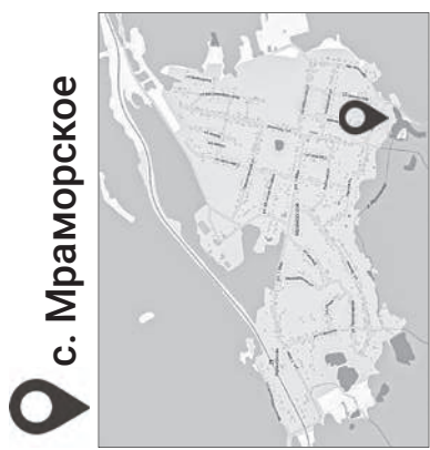
с. Мраморское Поляна у пруда

на въезде в город. Места отдыха – Северский пруд (берег р-на Далека), р. Чусовая (район бывшей фермы через поле от З. Бора, у моста через реку). Будут обработаны территории у родников Кособродского, Святоотроицкого (на берегу Северского пруда).