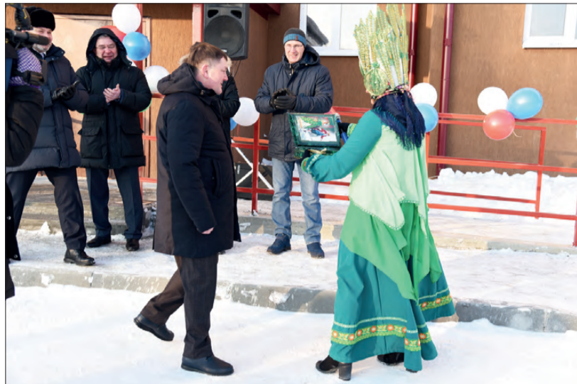
Символический ключ от нового дома вручает Хозяйка Медной горы.