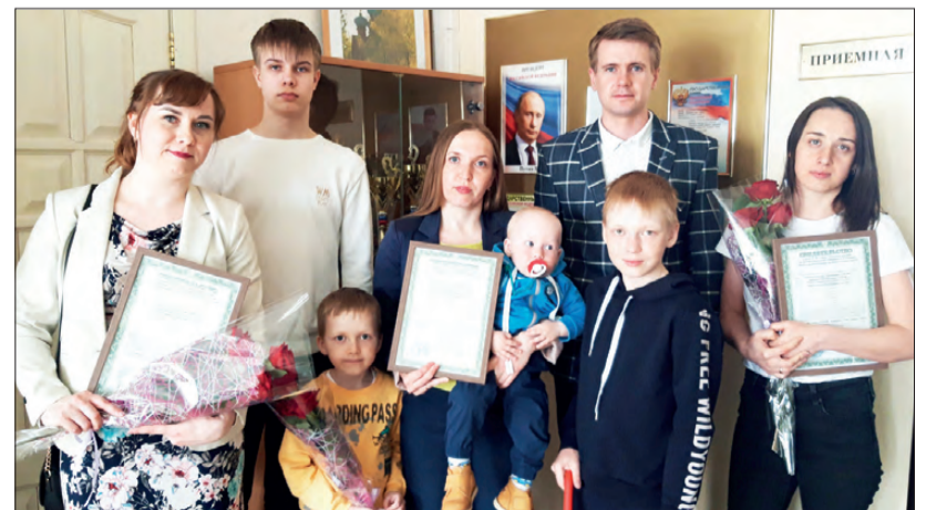
20 апреля 2021 года счастливыми обладателями свидетельства по региональной поддержке на улучшение жилищных условий стали три молодых семьи: Мешковых, Булатовых и Рязосовых.