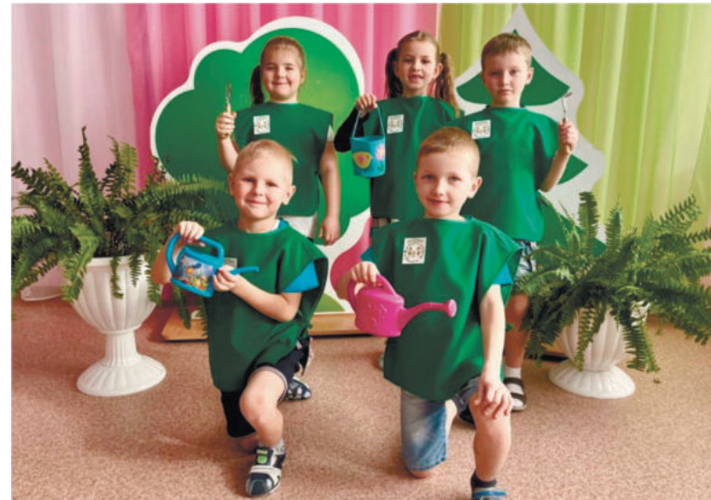
Команда «ЭкоСтрой», д/с «Жар-птица»

Елена Ваулина, педагог-организатор МОУ ДО «ДЭЦ»