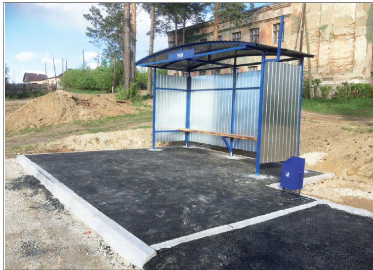
Новый остановочный комплекс на ул.Культуры.

ки по ул.Стахановцев, ремонт тротуаров по ул.Калинина и в районе обелиска, после раскопок в связи с коммунальными