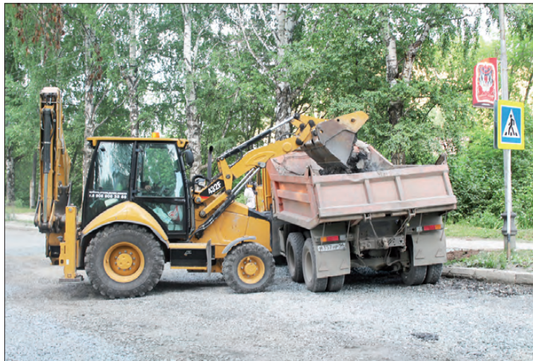
Идет ремонт дороги по ул. Калинина

Всё для водителей, а как же мы, пешеходы? И для нас есть хорошая новость! В ближайшее время начнется ремонт дорог с устройством тротуарной дорож-