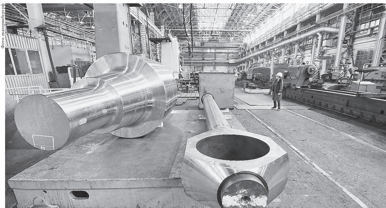
По данным министерства промышленности и науки Свердловской области, положительная динамика промышленного производства обусловлена действием сразу нескольких крупных проектов на ведущих промышленных предприятиях региона.