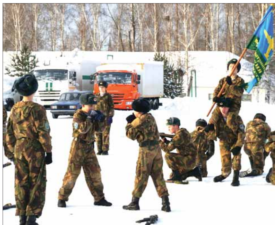
Клуб "Гвардия Урала" показывает свое мастерство

т.п. В октябре 2007 года личный состав ОЧН был задействован в подавлении массовых беспорядков на территории Кировградской воспитательной колонии ГУФСИН России по Свердловской области. Поставленные задачи были выполнены на высоком профессиональном уровне.