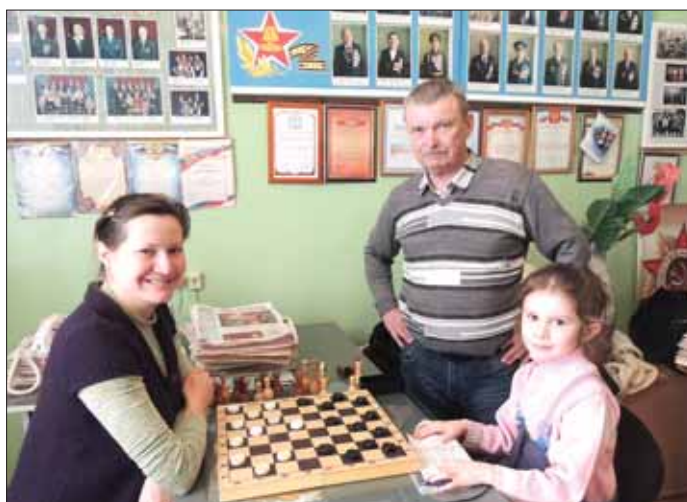
Интеллектуальные игры помогают весело и полезно провести свой досуг