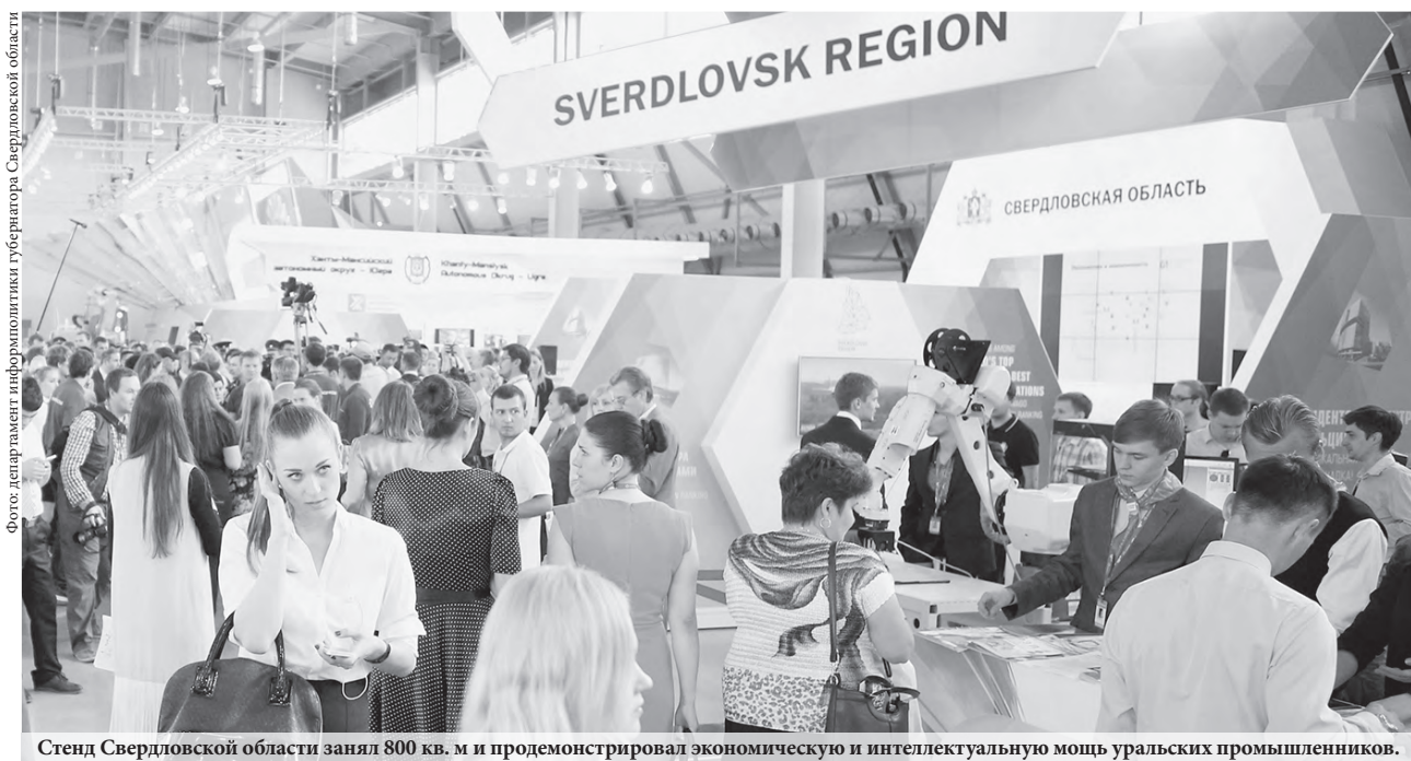
Стенд Свердловской области занял 800 кв. м и продемонстрировал экономическую и интеллектуальную мощь уральских промышленников.

С каждым годом Международная промышленная выставка ИННОПРОМ становится всё более интересной для топ-менеджеров и крупных инвесторов. По словам организаторов, здесь участвовали представители 95 стран. От страны-партнёра Индии в деловой программе приняли участие более 100 руководителей компаний. Китайская делегация насчитывала более 3 тысяч человек. Глава Минпромторга РФ Денис Мантуров также высоко оценил лоббистские усилия губернатора Среднего Урала по продвижению интересов свердловских промышленников. «Евгений Куйвашев активно продвигает продукцию предприятий региона не только на российском рынке, но и на межгосударственном уровне», – сказал Денис Мантуров.