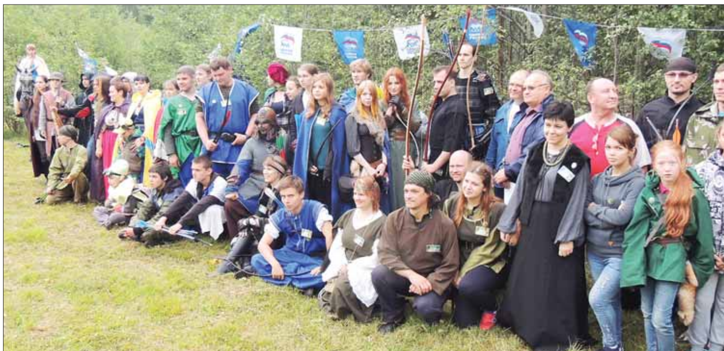
Народу было так много, что в кадр все не вмещались