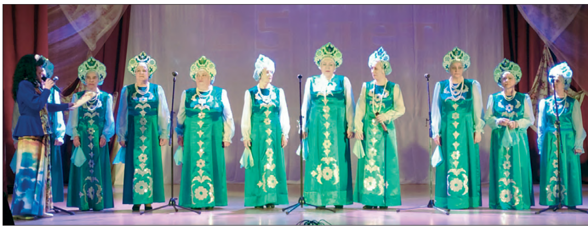
2022 год. Выступление хора на юбилейном концерте