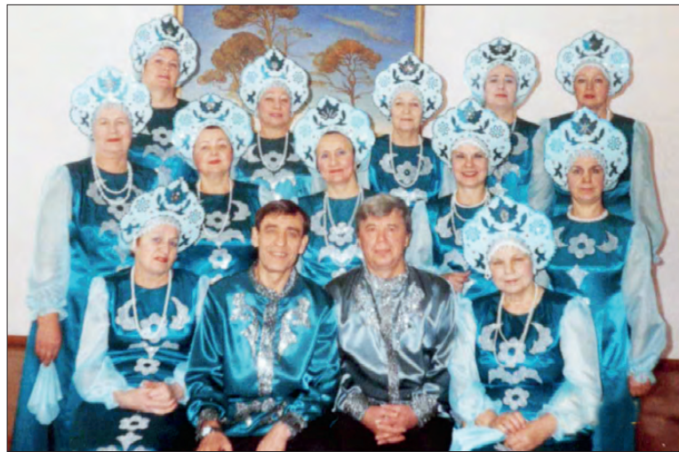
2007 год. Михайловск. Народный хор «Уральские зори» после выступления на фестивале русской песни