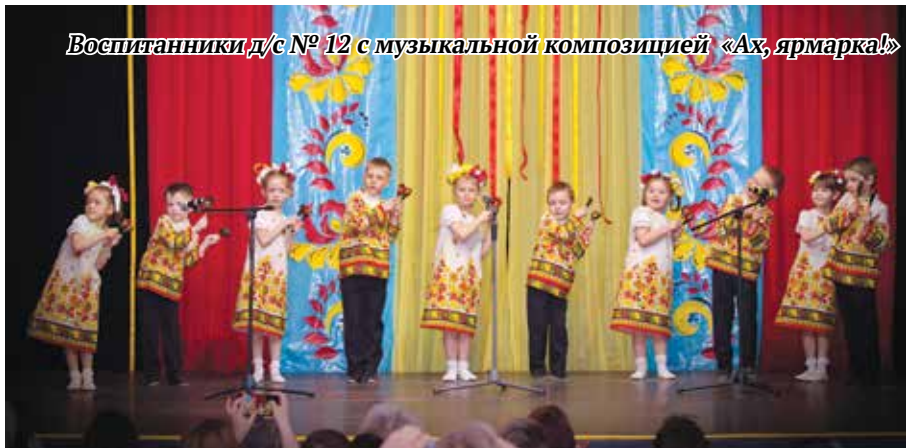
Воспитанники д/с № 12 с музыкальной композицией «Ах, ярмарка!»