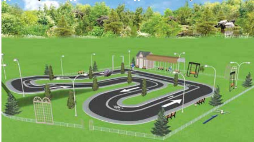
Дизайн-проект стадиона «Активное долголетие» на ул. Ленина

15 апреля в Свердловской области стартовало рейтинговое онлайн-голосование за объекты благоустройства 2023 года. Оно организовано в рамках федерального проекта «Формирование комфортной городской среды» на единой федеральной платформе 66.gorodsreda.ru и продлится до 30 мая включительно.