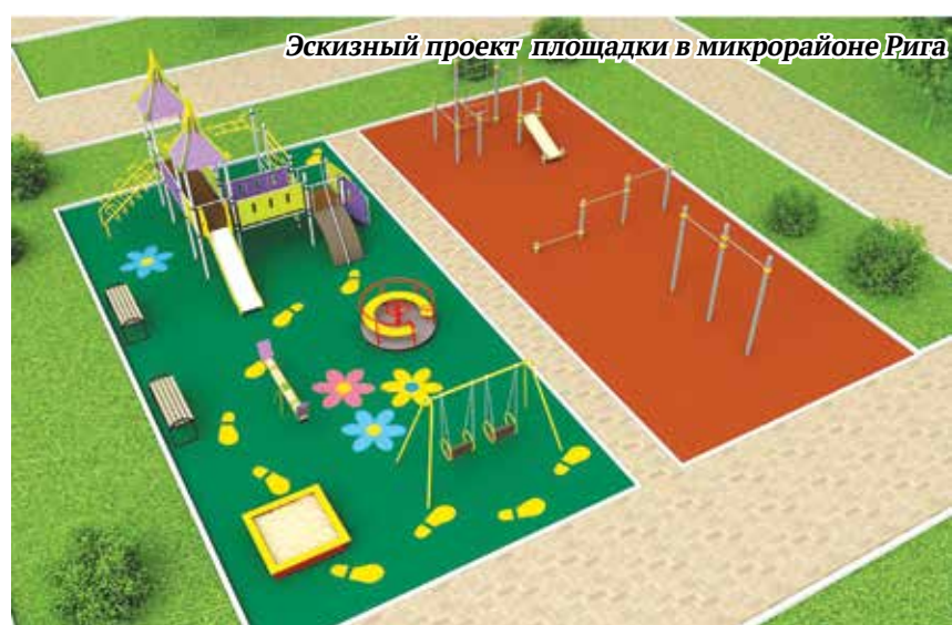
Эскизный проект площадки в микрорайоне Рига

ское рейтинговое голосование, глава региона Евгений Куйвашев, от того, как выглядят наши города, насколько хорошо и удобно в них организовано пространство, «зависит настрой людей на работу, на отдых и на саму жизнь». Очень важно, подчеркнул он, что «сейчас у жителей есть возможность самим решать, как должна быть преобразована близкая им общественная территория».