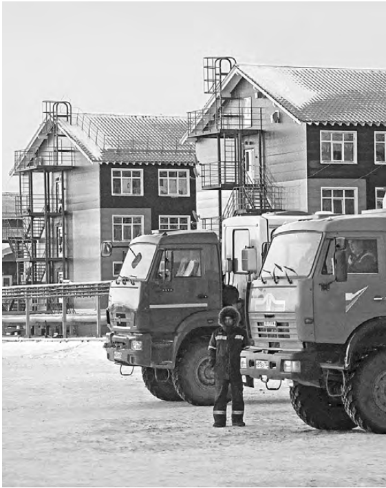
Некогда крошечный поселок Сабетта сегодня превратился в город с 30-тысячным населением. И все же большинство обитателей Заполярья—вахтовики.

—Поставлена задача увеличения финансирования всех социальных программ, чтобы сделать арктиче-ские регионы РФ привлекательными для жизни. Вся экономика и инфраструктура должны служить до-стижению этой цели. К сожалению, сейчас разорва-ны контакты по линии приграничного сотрудниче-ства, международные научные и образовательные проекты. Возможно, спелеоперация на Украине потре-бует и перекройки бюджета. Но приоритет в Арктике остается прежним—обеспечение необходимых усло-вий для постоянного проживания людей,—подчерки-вает ученый. ●