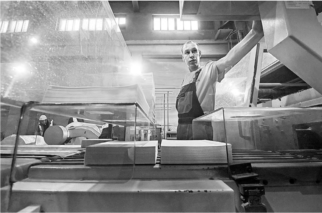
Туринский завод уже сейчас готов полностью покрыть потребности в офисной бумаге всей Свердловской области.

сты подойдут даже для проведения ЕГЭ: требование Министрства просвещения — не ниже 80 процентов белизны, а у туринского продукта — 105, то есть «белее белого». Сейчас предприятие может выпускать до миллиона пачек в месяц — этого хватит всей Свердловской области. Однако в планах — расширить производство и довести выпуск бумаги до 200 тонн в сутки. Это позволит туринцам занять 15 процентов российского рынка. ●